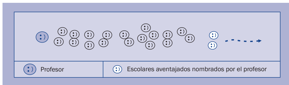
Figura 3. Disposición espacial en comitiva

Así, se pueden analizar y clasificar las posibles formas de disposición espacial de las personas participantes, y presentarlas en orden de progresiva especialización en cada sesión o grupos de sesiones de iniciación o de perfeccionamiento de la resistencia aeróbica, de manera que vivan el proceso de una forma atrayente, interesándose por cada nueva disposición espacial que les vaya proponiendo el profesor.