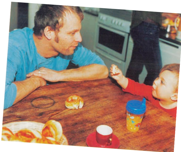
Fotografía que forma parte del libro Suecia abre el camino .

resistencias culturales que continúan penalizando socialmente a los padres que reclaman tal derecho. Mientras tanto, los servicios de atención a domicilio (SAD), difícilmente suelen ser pensados como una herramienta para la conciliación. En España ha habido que esperar al desarrollo de la mal denominada ley de la dependencia (LAPAD 2006) para que se los tuviese en cuenta. Y cuando existen, y la crisis de nuevo aparece como un escollo insalvable, son normalmente contemplados como un recurso útil para cuidar únicamente de las personas catalogadas como dependientes. Por lo tanto, continúan siendo considerados como servicios que quedan lejos de la conciliación que, al parecer, solo deben afectar a las mujeres madre con empleo.