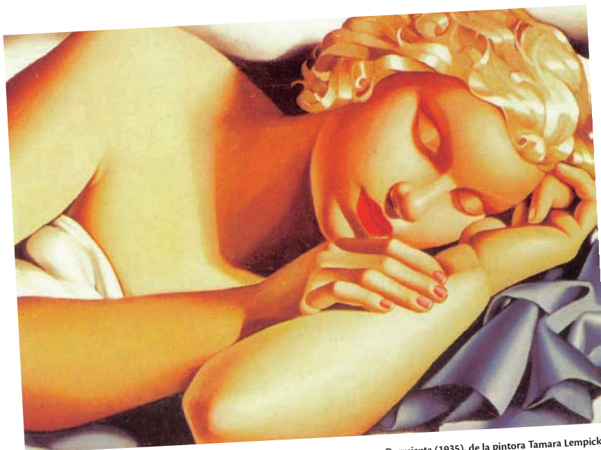
Durmiente (1935), de la pintora Tamara Lempicka.

Mujeres que se sienten, principalmente las de clases medias que bordean la cuarentena, como si el mundo, en general, y su en-