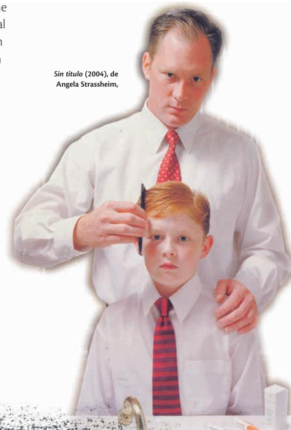
Sin título (2004), de Angela Strassheim,

Antes de que la conciliación hiciese su aparición, las alternativas europeas a anteriores crisis de empleo parecían encaminarse hacia el reparto del trabajo y la reducción de la jornada laboral. Algunas estudiosas avisaron de que la conciliación había substituido a las propuestas del reparto del trabajo. Y algunas de nosotras ya hacía más de una década que confiábamos en la mencionada reducción horaria y precisábamos que debía plantearse en clave sincrónica y cotidiana. Ya que solo