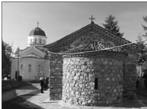
3. Monasterio de Kremikovtsi