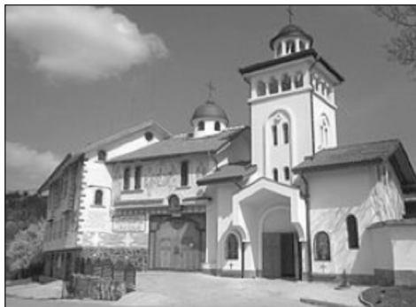
1. Monasterio de Klisura