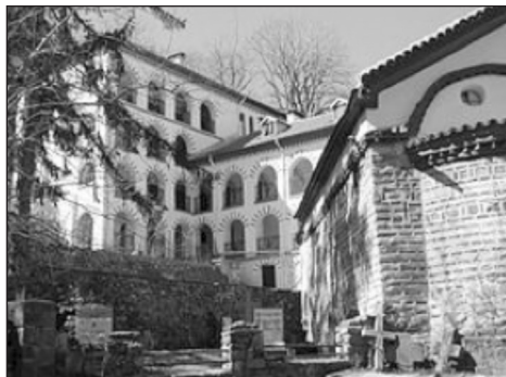
2. Monasterio de Dragalevtsi