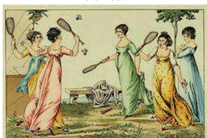
Figura 2. Joc del volant, practicat per dones.

Unes pràctiques també de diades festives, però també molt en voga en el dia a dia, són els jocs de xarranca i les seves nombroses variants, com el marro i el titllo (Amades, 1947), anomenats amb altres noms en castellà com «tánganas, tejos o chitas» (Santos, 1876). Són en general d'ambdós sexes i practicables pels carrers en qualsevol moment, tal com es comprova en diversos gravats, com el de l'obra Juegos de la Infancia (vegeu la figura 3). A més, no impliquen una gran despesa física ni tampoc un contacte entre companys, característiques òptimes perquè el joc el duguin a terme les noies.