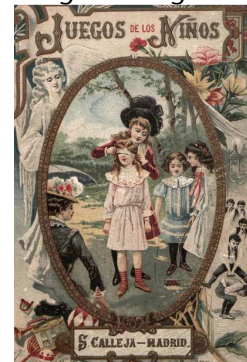
Figura 5. Noies a punt de jugar al puput o gallina ciega.