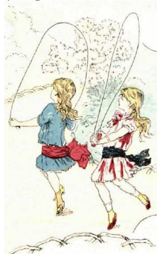
Figura 4. La corda, pràctica de noies, en l'obra Los juegos de la Infancia .

Aquesta sexualitat es fa palesa en diversos gravats (vegeu la figura 5) i també en els relats de José Osés (1915), que comenta que el joc està destinat indistintament als nois i a les noies i, per tant, hi jugarien plegats, fet que reforçaria aquesta connotació sexual, tot i que també indicaria la inclusió de la pràctica en el sexe masculí més tard que en el femení.