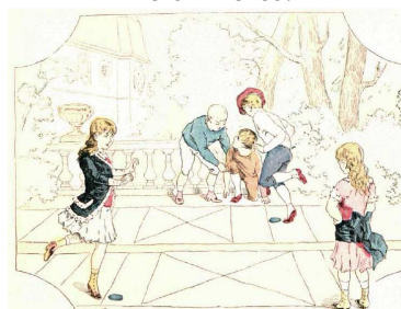
Figura 3. Joc de la xarranca, practicat per nois i noies.