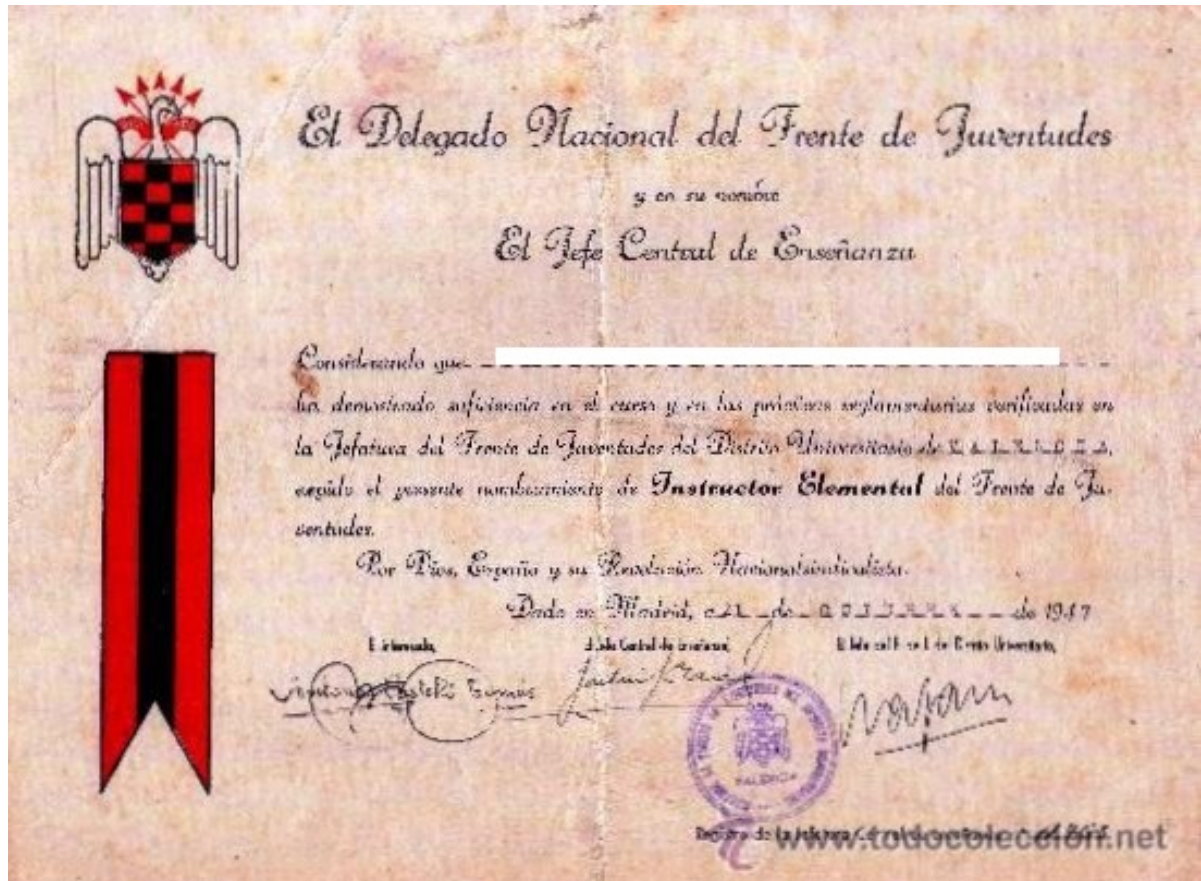
Título de Instructor Elemental que el Frente de Juventudes concedía a los maestros en el curso de capacitación necesario para ejercer la docencia del Magisterio (1947)