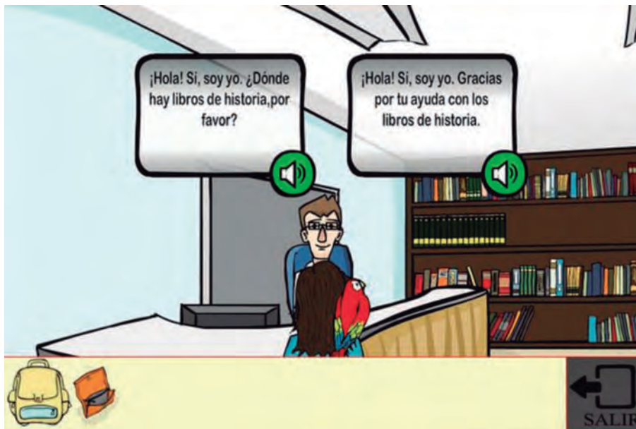
[FIGURA 2] EJEMPLO DE DINÁMICA EN LA QUE EL JUGADOR DEBE DIFERENCIAR ENTRE MODALIDADES (I.E. INTERROGATIVA VS. ENUNCIATIVA) PARA ESCOGER LA ACTUACIÓN COMUNICATIVA ADECUADA A LA SITUACIÓN CONTEXTUAL..

Como hemos dicho, el hilo argumental es de fácil comprensión: un personaje corriente (el jugador) se enfrenta a una situación extraordinaria (salvar a una ciudad de la destrucción ambiental gracias a la recuperación de una piedra mágica que debe devolver al ayuntamiento) de manera que se convertirá en un héroe cuando consiga finalizar el juego. A lo largo de toda su aventura, le acompaña una mascota. Este personaje tiene una función principal en el videojuego, ya que opera de acompañante virtual; guía al jugador en su camino proporcionándole las instrucciones que necesite para realizar cada una de las tareas que va encontrando. Si el jugador tiene dificultades para superar la prueba, le ofrece más pistas o, en último término, la solución.