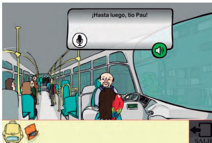
[FIGURA 3] EJEMPLO DE DINÁMICA EN LA QUE EL JUGADOR DEBE GRABAR CON SU PROPIA VOZ LA ORACIÓN QUE APARECE EN LA PANTALLA. EN ESTE CASO, SE TRABAJA UN ACTO DE HABLA CONCRETO (I.E. DESPEDIDA) EN UN CONTEXTO INFORMAL (I.E. UN FAMILIAR).