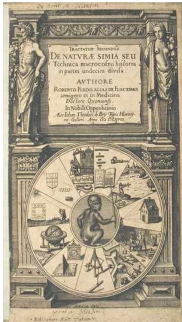
Utriusque Cosmi Maioris scilicet et Minoris Metaphysica, Physica Atque Technica Historia

Da mesma forma que Kepler se aproximou de Robert Fludd fascinado pelas imagens que foram incluídas numa obra deste que ele descobriu por acaso 2 , não parece que em nenhum momento o filósofo inglês entendera o fato de que estava defendendo uma postura, a da validação hermenêutica das imagens, que estava com seus dias contados. Ainda que Kepler acuse Fludd de fazer imagens poéticas no sentido da poiesis aristotélica, nem por isso renega ainda o seu uso, ainda que distinga significativamente entre o que ele denomina de imagens divertidas e de imagens objetivas, sendo apenas por meio destas últimas que os objetos do mundo são representados diretamente na alma 3 : “a visão é originada pela imagem da coisa