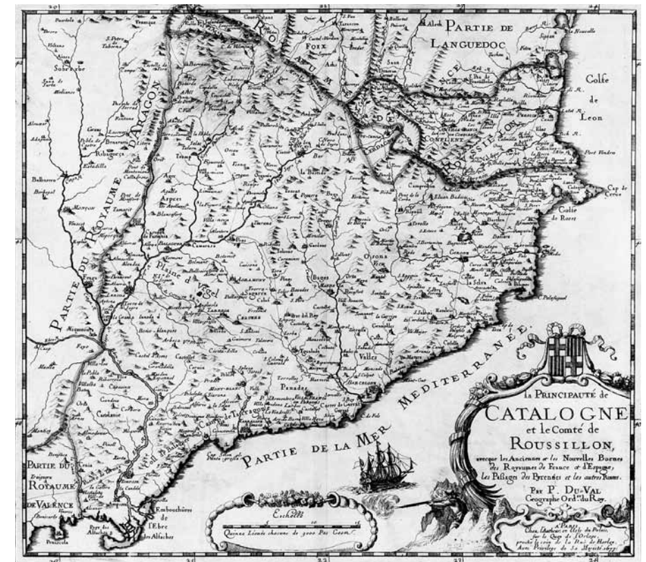
Mapa del principat de Catalunya i comtat de Rosselló, de P. Du-Val, ca 1667.

se llegue a términos de que les podrán resultar mayores inconvenientes ». El cert és que al virrei a penes si li arribava res per mantenir les seves tropes, una realitat que l'agent de Vic a la cort, J. Francolí, va transmetre molt bé quan parlava de «la poca providencia de la nació, que nunca tienen mañana, y lo pehor que [h]ay en la materia es que ay (sic) [ahí] están acabados». 4