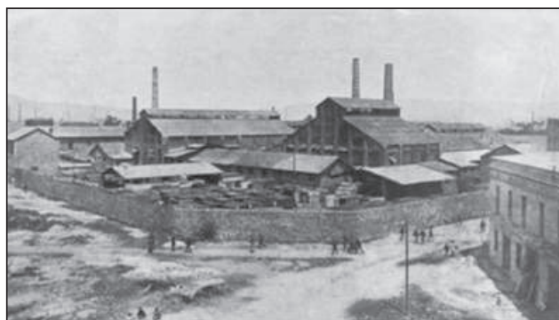
Figura 2 CAN GIRONA CON LA TORRE DE LAS AGUAS (1930)