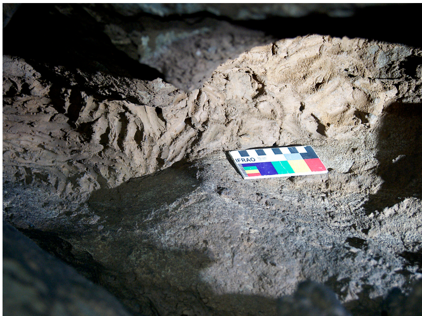
FIG. 5. Marcas que podrían estar relacionadas con la extracción de la arcilla en el extremo de la galería terminal.

2. Presencia de rebabas: casi todos ellos conservan rebabas, en algunas ocasiones de gran tamaño (Fig. 3). Estos productos de la sustracción de la