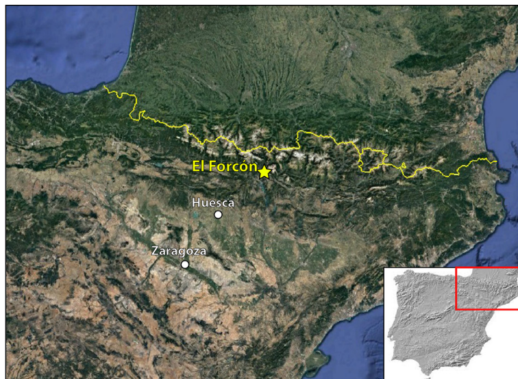
FIG. 1. Mapa con la ubicación de la Cueva del Forcón.

de la primera galería se localizan unos depósitos de arena fluvial, de granulometría muy fina. El paso por esta superficie es obligado para acceder a la parte más interna de la cueva y, sin embargo, las arenas aparecieron inalteradas desde largo tiempo, con las marcas superficiales del goteo del techo, dando cuenta del reducido tránsito por ella en las últimas décadas, lo cual, sumado a su difícil acceso, podría avalar la preservación de motivos parietales de época prehistórica.