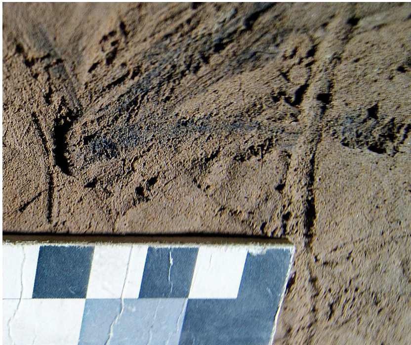
FIG. 4. Detalle de superposición de un trazo digital a uno de los trazos negros de carbón.