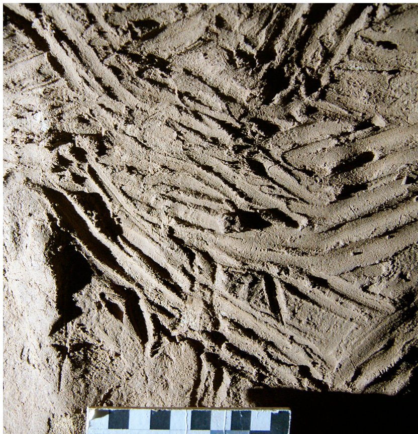
FIG. 3. Panel de trazos digitales en el que se puede apreciar la ausencia de pátina y erosión y la presencia de rebabas.