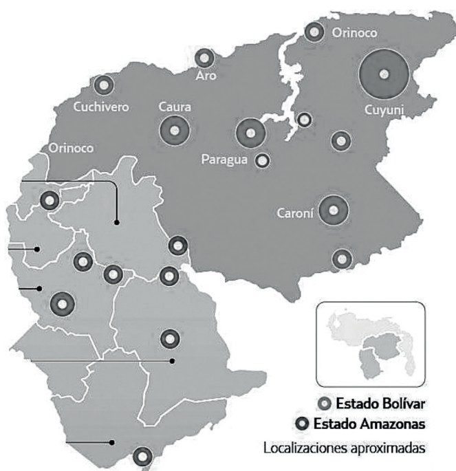
Gráfico 3. Cuencas afectadas por la minería ilegal en el estado Bolívar. Elaborado a partir de http://www.el-nacional.com/sociedad/control-logrado-extraccion-ilegal-Guayana_0_644935743.html