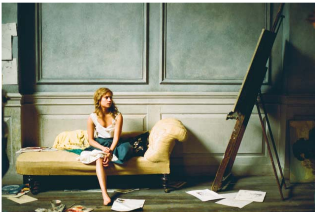
A dalt, Alicia Vikander conduint en una escena d'Operació U.N.C.L.E.'. Sobre aquestes línies, a la pel·lícula 'La noia danesa'

“Alicia Vikander té l'estoïcisme dels ballarins. És dura, sense ni un pèl d'afectació” A. GARLAND, DIRECTOR D'EX MACHINA'