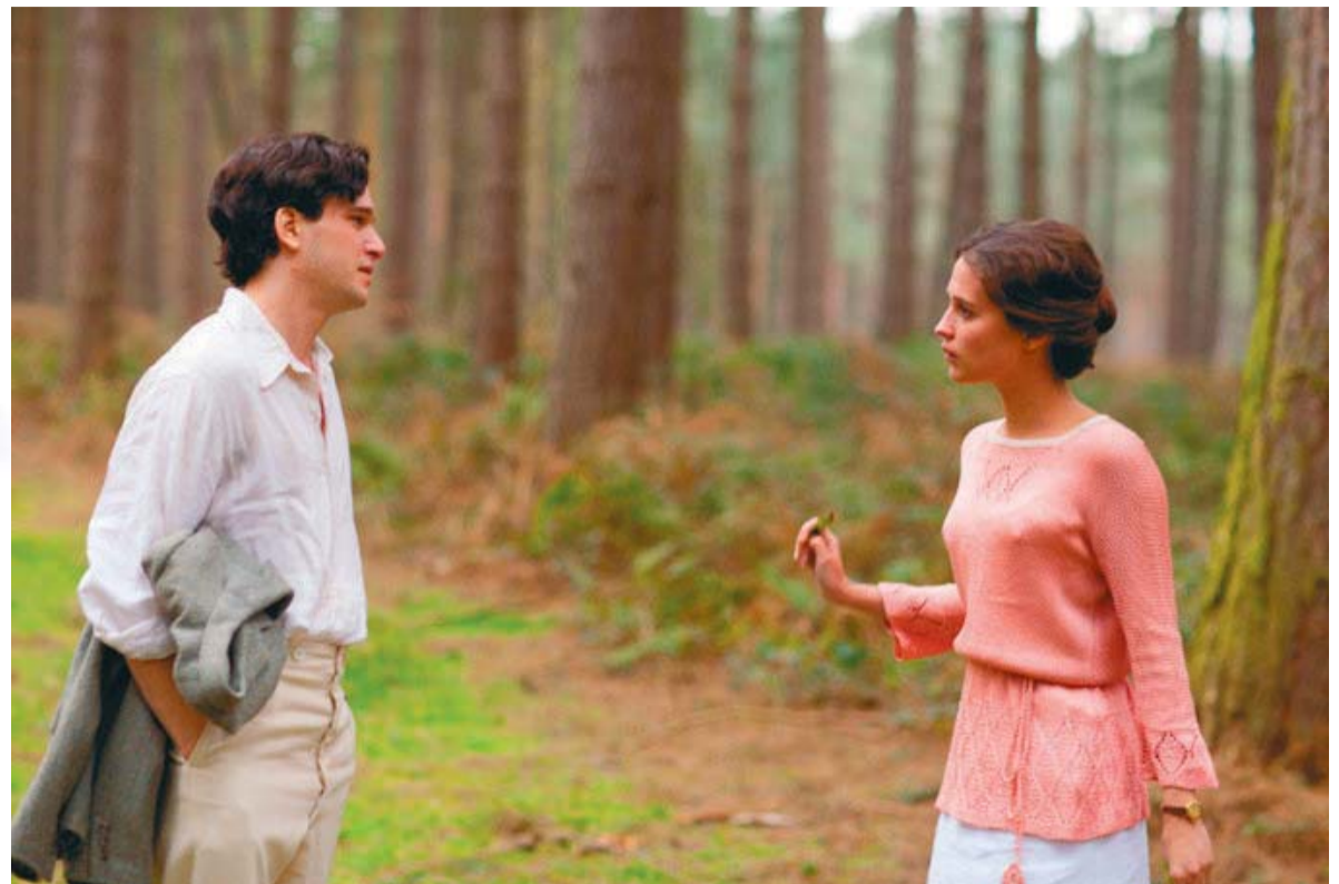
Alicia Vikander amb Kit Harington en una escena de 'Testament de joventut' (2014)

“M’encanta sortir de la meua zona de confort”