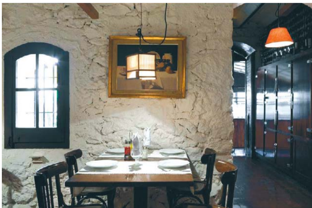
Interior del Bar Delicias del Carmel, hàbitat natural del Pijoaparte.