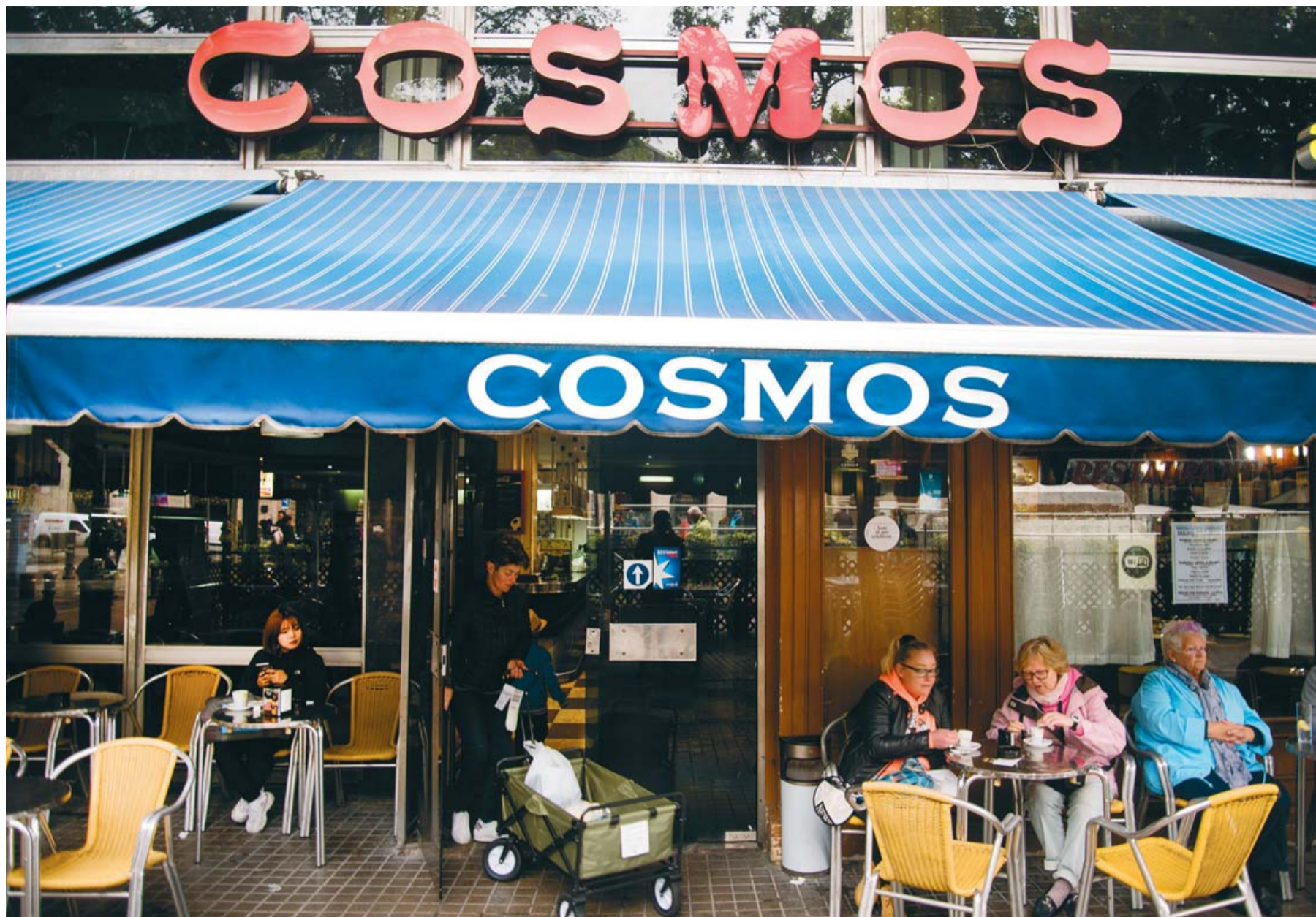
El Bar Cosmos, a les Rambles

Recorrem la Barcelona del Pijoaparte, el protagonista arribista i xarnego que intentava seduir una noia de casa bona a 'Últimas tardes con Teresa'