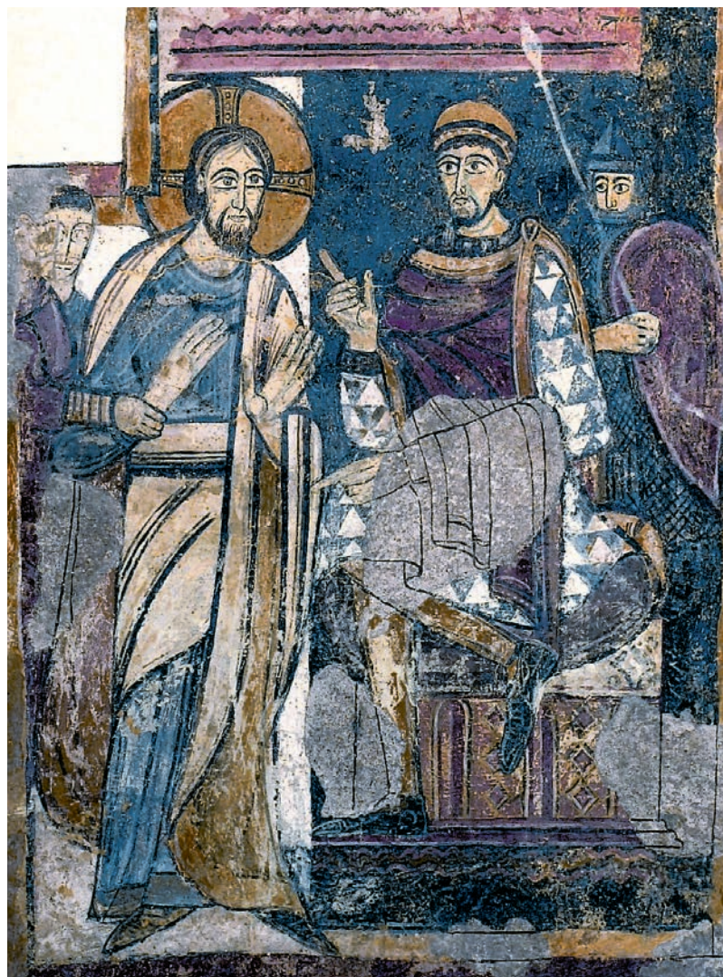
Jesús al Pretori davant Pilat.

Alguns historiadors han apuntat que aquestes pintures de caràcter apocalíptic podien haver rebut la influència de les miniatures dels beatús, és a dir, els manuscrits transmissors del Comentari