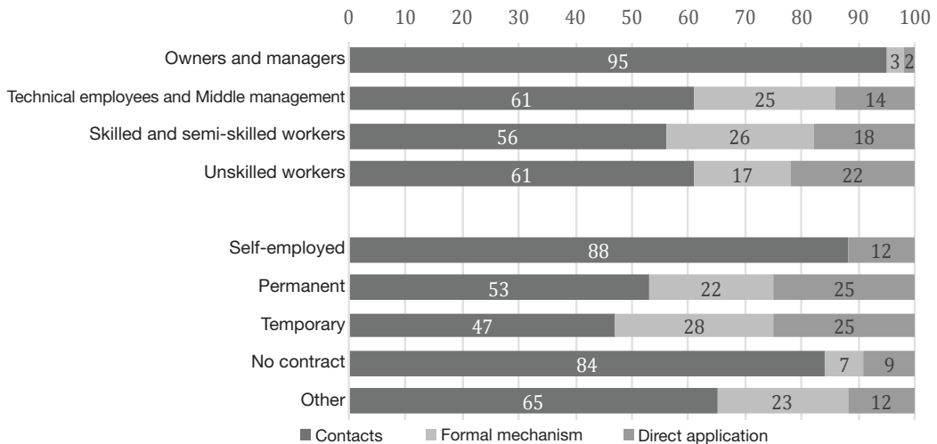
GRAPH 1. Hiring channel by employment status and contractual relationship (n=1585 jobs, %) 11

The fourth objective in our analysis is to examine empirically if, in the context of an employment crisis, there is a relationship between access to and use of social capital and employment outcomes. We focus specifically on occupational category. Our interest is not on the use of contacts in itself, but on whether or not the social position of those contacts (based on their proximity to ego and