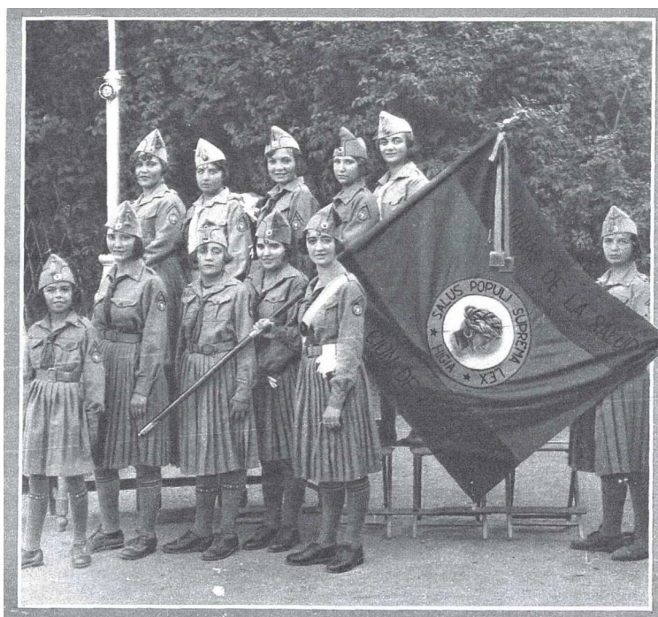
Foto 1: "Las Legionarias de la Salud." (Foto Zapata). Estampa , 15 de octubre de 1929, 1.

Key words: WOMEN'S EDUCATION; WOMEN'S STUDIES; WOMEN'S HISTORY; REGENERATIONISM; WOMEN'S ASSOCIATIONISM