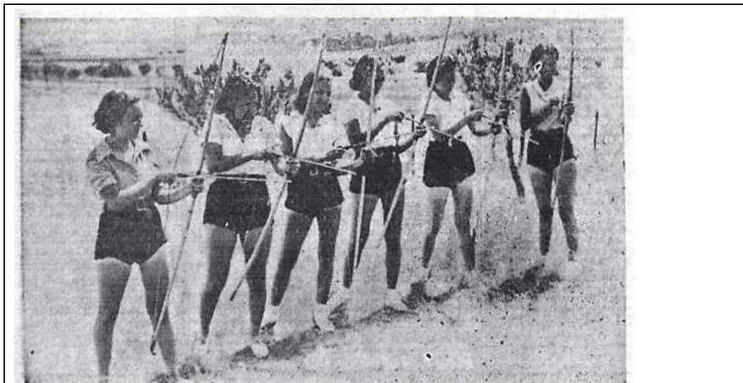
Foto 6: “Un nuevo deporte... que es viejísimo.—Las Legionarias de la Salud han resucitado el deporte del tiro con arco, tan femenino y tan gracioso.” (Foto Albero y Segovia).

La Voz (Madrid), lunes 6 de agosto de 1934, 8.