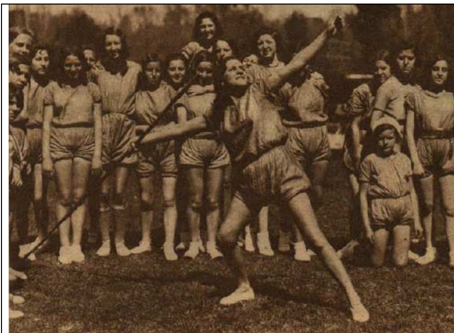
Foto 5: “Legionarias de la Salud en prácticas de lanzamiento de jabalina, en su campamento de la Casa de Campo.”. Ahora (Madrid), 16 de abril de 1932, 16.

En sus “excursiones” dominicales, las Legionarias practicaban con asiduidad pruebas de atletismo, desde las más sencillas, como carreras de velocidad (50, 60, 100 metros lisos) o saltos de altura y de longitud, hasta otras más complejas como lanzamientos de disco o de jabalina. (Foto 5.)