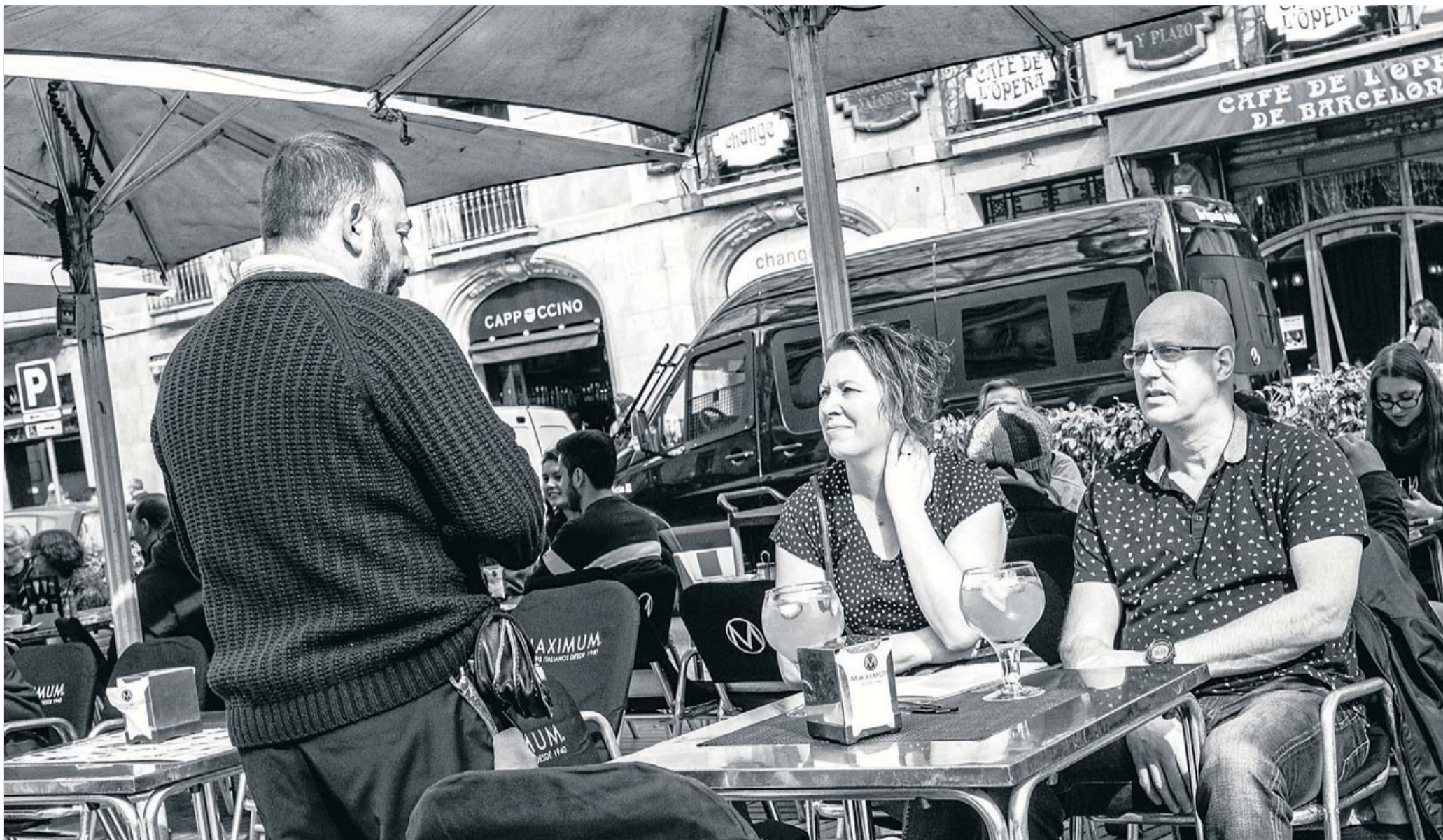
Una parella de turistes a la terrassa del Café de l'Òpera amb un dispositiu dels Mossos d'Esquadra en tasques de vigilància, divendres al migdia. XAVIER BERTRAL