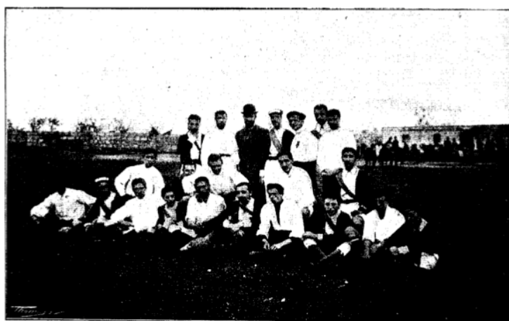
Figura 3. Los equipos “España” y “Barcelona”, después de jugar un partido en Palma de Mallorca.

Revisión. Revisión documental. Los inicios del fútbol en Palma de Mallorca, en torno a los orígenes del deporte escolar. Vol. V, nº. 1; p. 3-29, enero 2019. A Coruña. España ISSN 2386-8333 como una expresión de participación libre y democrática, como un proyecto de vida, que superaba, incluso, a la autoridad científica y la disciplina moralizante con la que se quería imponer la gimnástica escolar. El deporte (el fútbol) estaba empezando a ganar los primeros pulsos a la Educación Física (Torrebadella, 2012c). No obstante, como tratan Torrebadella y Vicente (2017, p. 14), el fútbol también representaba “un dispositivo disciplinario y de dominación” en el seno de las instituciones escolares.