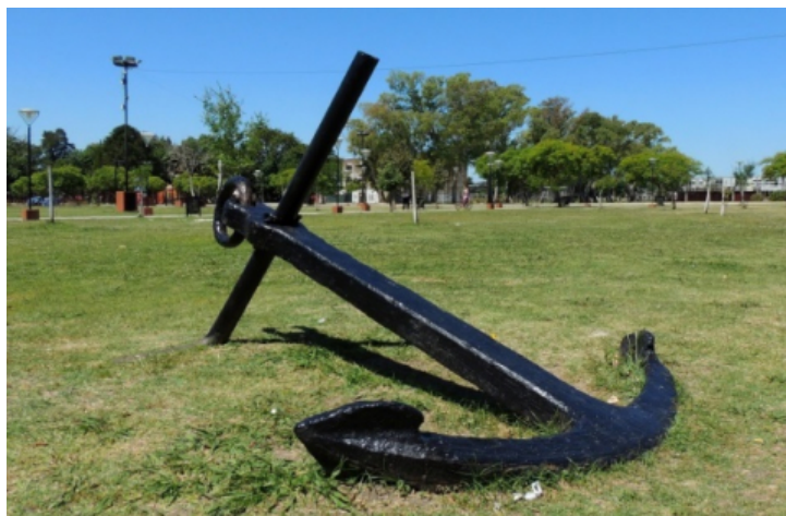
Foto n° 6 (Herrera, N., 2015) Ancla que recuerda el origen ultramarino de la población local