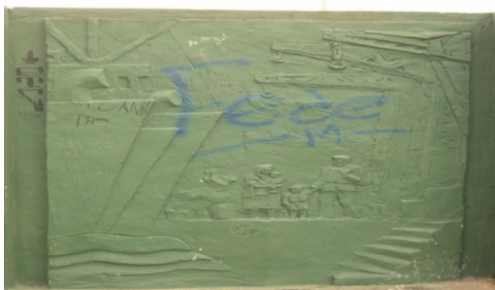
Foto n° 5 Monumento que rememora la llegada de inmigrantes (en barco) a Berisso