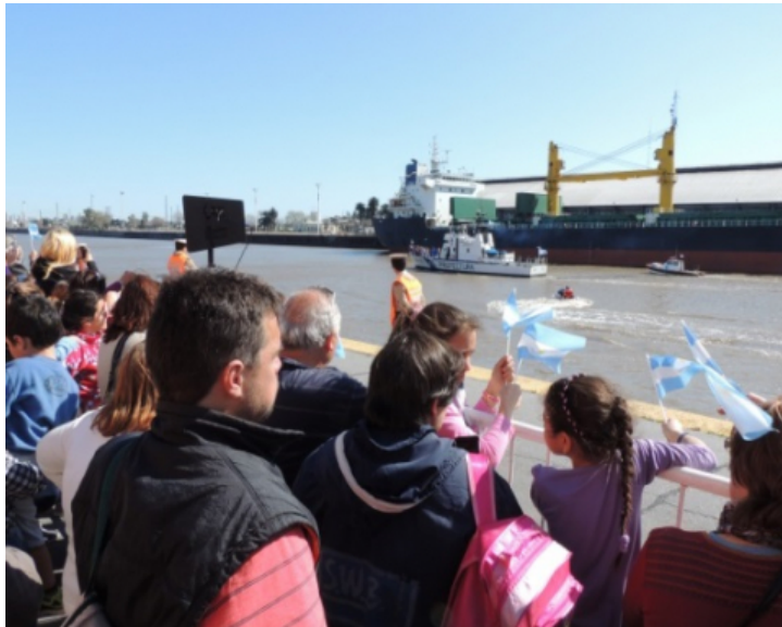
Foto n° 2 (Herrera, N., 2015) Llegada del barco con los descendientes de inmigrantes al Puerto