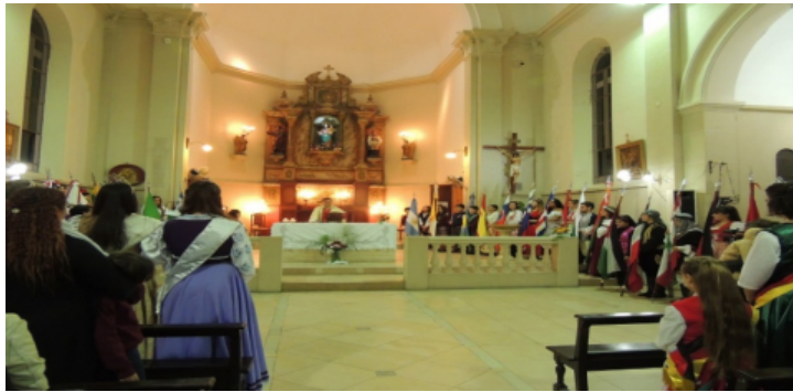
Foto n°1 (Herrera, N., 2015) : El cura, los abanderados y las reinas de cada asociación rodeando el altar