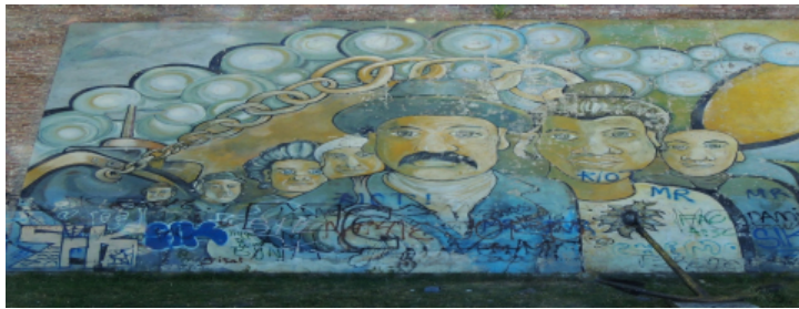
Foto n° 7 (Herrera, N., 2015) Mural que narra la historia de Berisso