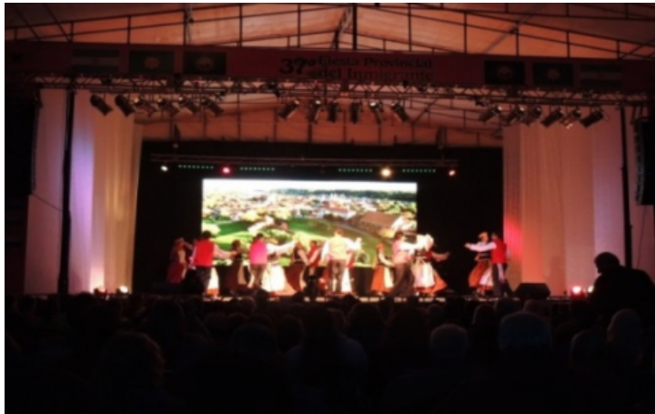
Foto n° 9 (Herrera, N., 2014) Bailes tradicionales sobre el escenario