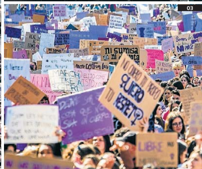
01. La manifestació d'estudiants a Barcelona baixant pel carrer Pelai. 02. Els joves van estar acompanyats també de gent gran. 03. Els lemes, a milers.