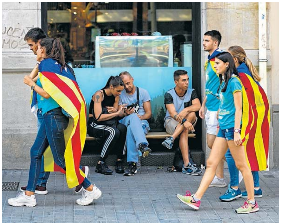
Un grup de joves dirigint-se cap a la manifestació ahir a Barcelona.