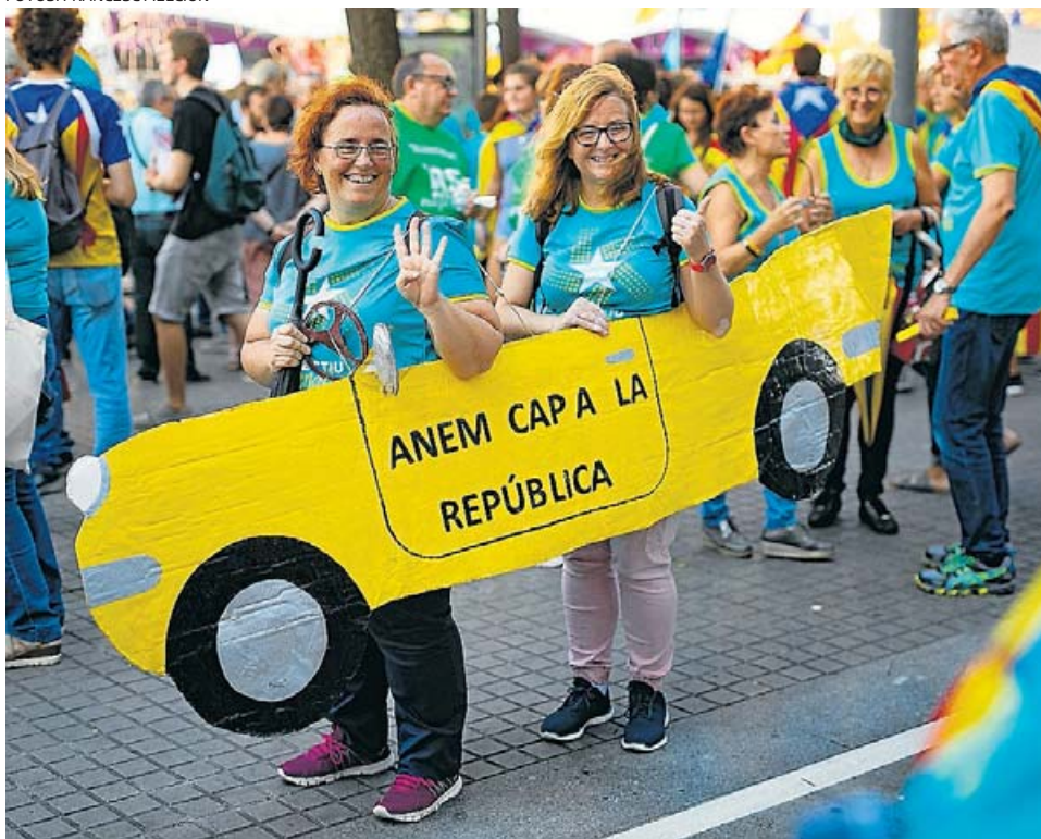
Dues manifestants ahir a Barcelona.