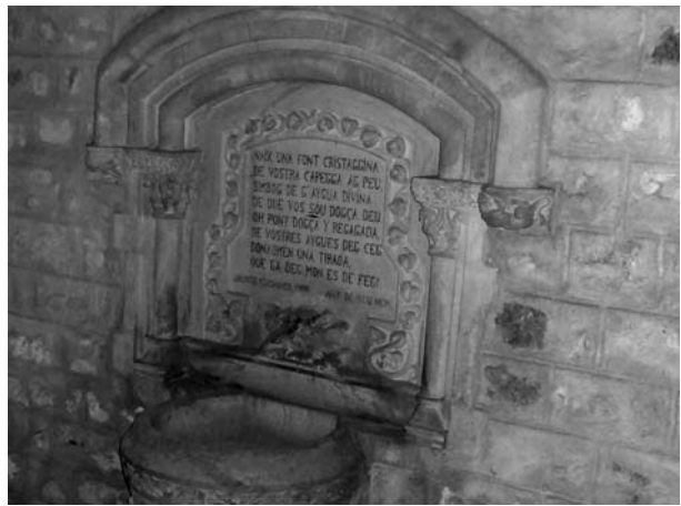
Font amb el fragment de poesia de Verdager al Castell de Santa Florentina.