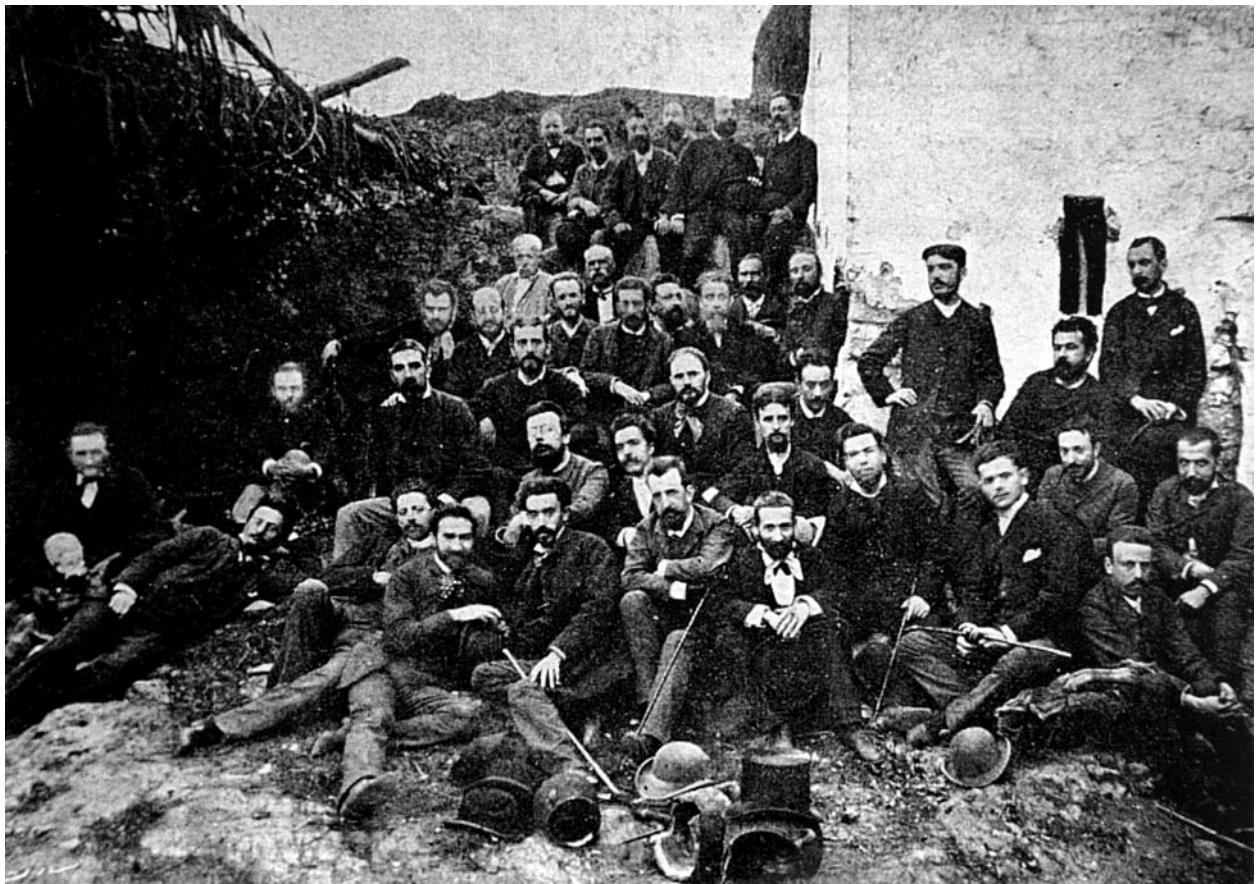
Fontada i dinar a can Roca Pagès de Sant Pol el 21 d'octubre de 1883 amb el més selecte de la intel·lectualitat catalana del moment.