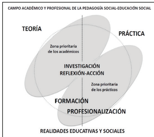
Figura 1. La convivència d'acadèmics i professionals en la pedagogia social i l'educació social

a l'acadèmia com a la professió. A la figura 1 es pot observar com aquests autors plantegen un model d'integració entre el camp acadèmic i el professional.