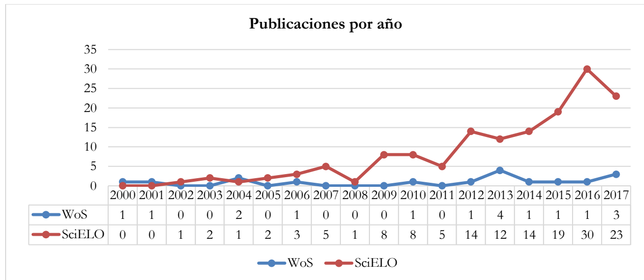
Figura 1. Publicaciones latinoamericanas de experiencia del estudiante en educación superior por año, en WoS Core Collection y SciELO Citation Index (2000-2017).

Como se puede ver en la figura1, las publicaciones tienden a aumentar hacia el final del período estudiado. Es importante mencionar que no se cuenta con datos previos a 2002 para la biblioteca de citas SciELO. WoS cuenta con un total de 17 publicaciones, y SciELO con 148.