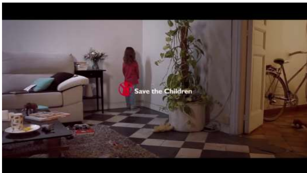
Figura 10 – “Pobreza infantil en España” (Spot Save the Children)