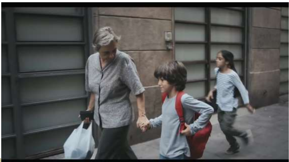
Figura 2 – “Abuelos Solidarios” (Spot Educo)

Veamos un par de ejemplos, sólo a título de muestra. El primero de ellos remite al spot “Abuelos solidarios”, que forma parte de una campaña de sensibilización de la ONG Educo (2015) orientada a la promoción de becas comedor y que muestra algunas consecuencias de la precariedad familiar, no visible en términos de pobreza extrema, pero sí apreciable en intrahistorias familiares de vulnerabilidad: “Dejar de comer bien para que puedan hacerlo sus hijos o nietos: esta es la realidad de muchos abuelos y abuelas en España” (EDUCO, 2015). En su versión extendida (1’ 13”), vemos a un personaje femenino caracterizado como una mujer anciana acompañando a un niño y una niña por la calle (Figura 2). Llegan a casa (parece por el contexto que de la mujer) y ésta se pone a cocinar (Figura 3), saliendo al poco tiempo de la cocina hacia el comedor con dos platos (Figura 4) que deposita en la mesa (Figura 5). Tras llamar a comer a los niños, vemos a estos sentados a la mesa ante los platos (Figura 6) mientras preguntan: “Abuela, ¿por qué tú no comes con nosotros?” y ésta responde: “La abuela no tiene hambre, cariño”, mientras la vemos, sentada y sola, con un mendrugo de pan entre las manos (Figura 7).