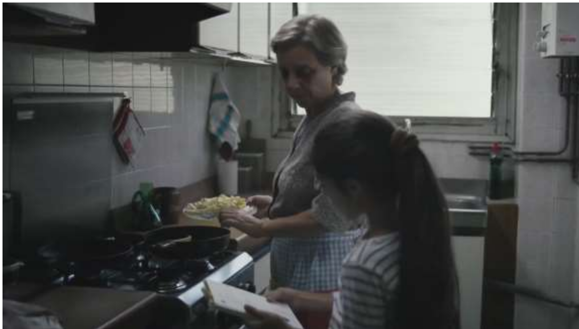
Figura 3 – “Abuelos Solidarios” (Spot Educo)