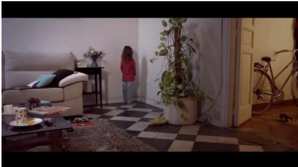
Figura 8 – “Pobreza infantil en España” (Spot Save the Children)