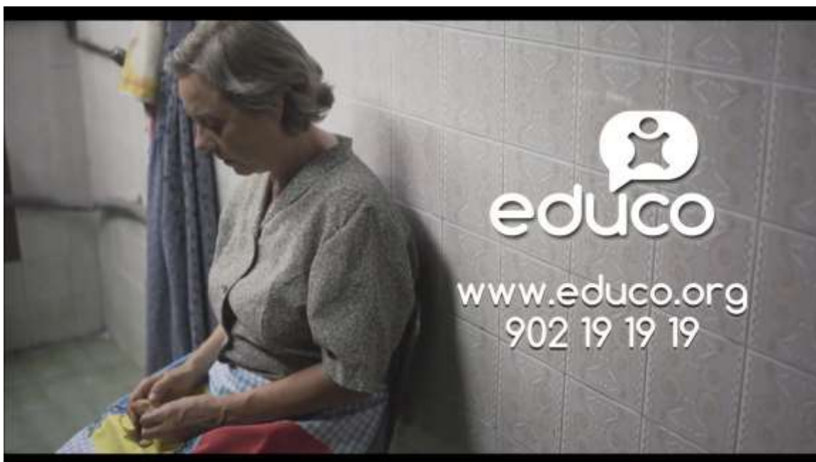
Figura 7 – “Abuelos Solidarios” (Spot Educo)