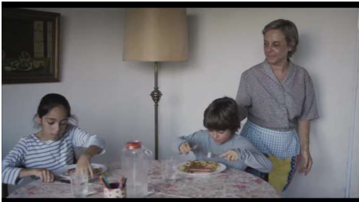
Figura 6 – “Abuelos Solidarios” (Spot Educo)