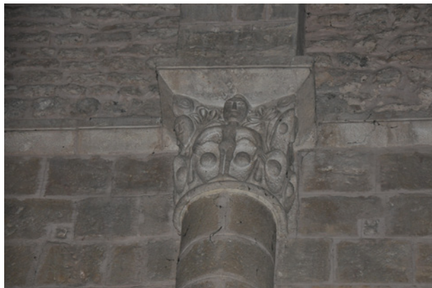
Fig. 3. Capitell amb escena figurativa