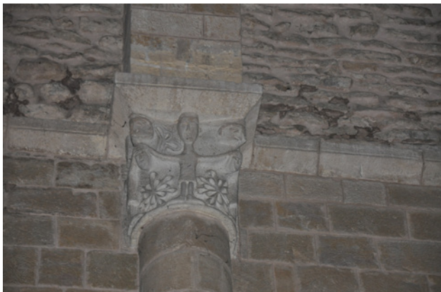
Fig. 2. Capitell amb escena figurativa