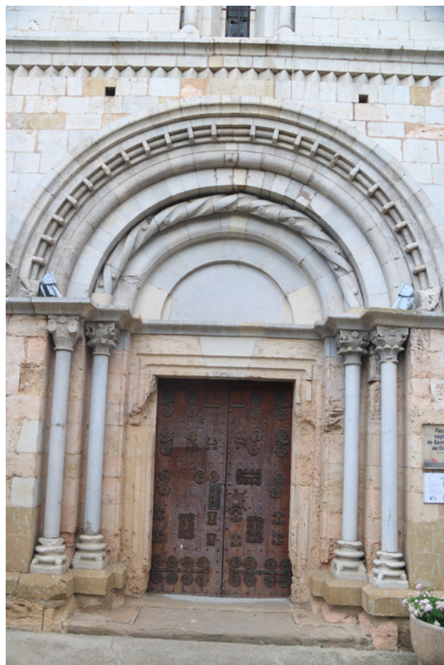
Fig. 8. Portalada de Santa Maria de Cistella.