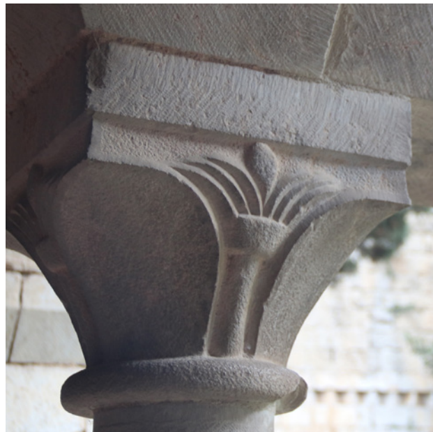
Fig.18.Capitell del claustre de Santa Maria de Vilabertran