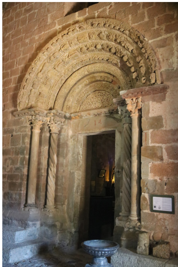
Fig. 10. Portalada de Santa Maria de Costoja