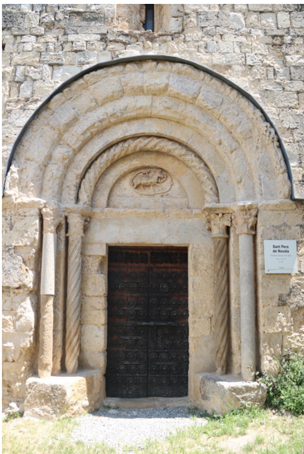
Fig. 7. Portalada de Sant Pere de Navata

Els capitells de la portada, derivats del corinti, presenten decoració en tres nivells: dos de fulles d'acant i un tercer amb un motiu floral i volutes (fig.9). Aquest tipus de decoració, de clara empremta antiquitzant, apareix de forma recurrent en diversos conjunts situats a l'antic comtat de Besalú, concretament a les portades de Sant Joan les Fonts, Santa Maria de Cistella, Sant Pere de Navata, Santa Maria de Costoja i a l'hospital de Sant Julià de Besalú. El capitell interior del brancal esquerre del portal presenta una lleugera variació respecte de la resta. Tot i que repeteix el model derivat del corinti amb tres nivells de fulles, la seva superfície rep un tractament a base de palmes.