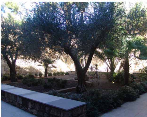
Fig. 11. Pati central del claustre