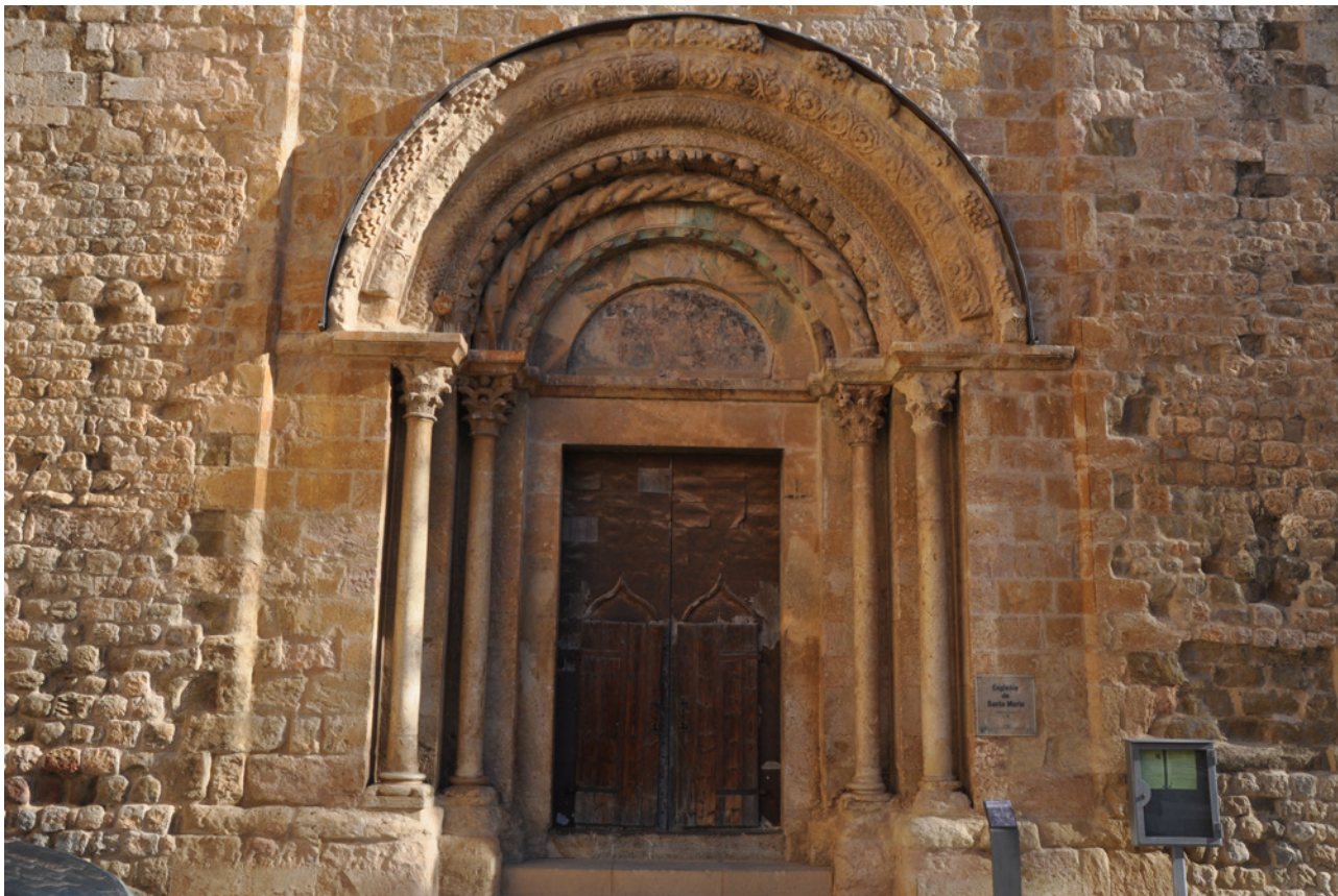
Fig. 6. Vista general de la portalada

vestigis de dues torres que no es van arribar a edificar. Cal pensar que només es va executar una part del primer pis de la torre meridional, amb dos grans finestrals inacabats i coronats posteriorment com a campanar. La façana havia de ser per tant simètrica, amb un cloquer a cada extrem.