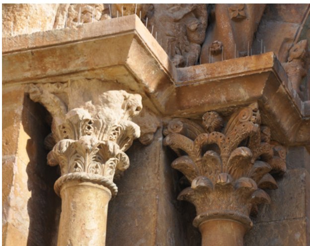
Fig. 9. Capitells del brancal esquerra de la portada