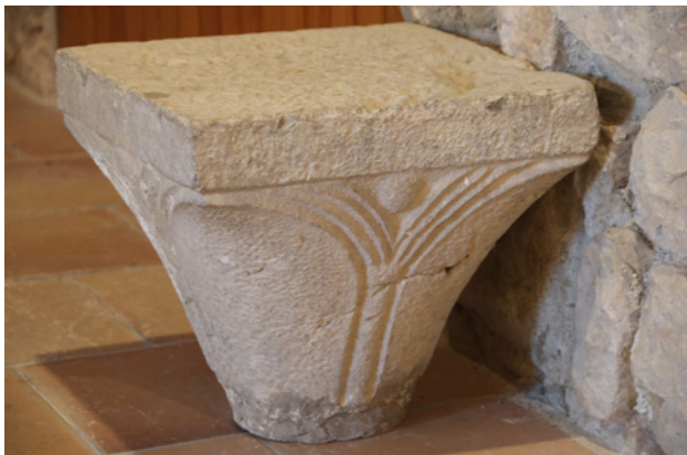
Fig.17.Capitell procedent del claustre, avui conservat a les dependències de la canònica