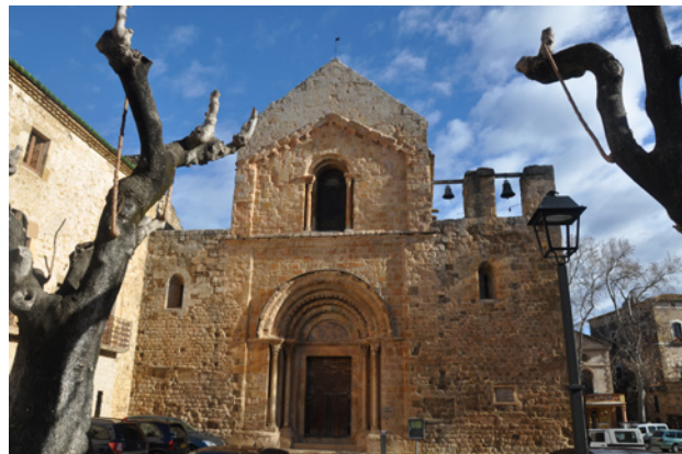
Fig. 5. Vista general de la façana occidental

La coberta de la nau central es resol mitjançant una volta apuntada reforçada amb tres arcs torals, també apuntats, que arrenquen de semi-columnes adossades als pilars que suporten els arcs formers. Les naus laterals són cobertes amb voltes de quart de cercle, i només tenen un arc toral, de mig punt, sobre pilastres rectangulars, vers l'extrem occidental.