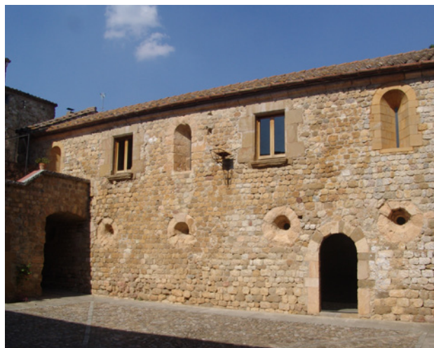
Fig. 12. Dependències de l'antiga canònica augustiniana

D'altra banda, els capitells de Lladó segueixen el model d'alguns capitells de la nau central del veí monestir de Sant Pere de Rodes, que també presenten una estructura derivada del corinti amb dos nivells de fulles d'acant i un tercer corresponent a les volutes. En aquest sentit, cal pensar que probablement Rodes es va convertir en un focus d'irradiació i important centre de referència per a conjunts erigits en el territori de l'antic comtat de Besalú durant la segona meitat de segle XII, com és el cas de Lladó i Cistella. Pel que fa a la cronologia del temple, si admetem les relacions de la portalada amb l'escultura de Costoja i les experiències rosselloneses, sembla improbable que la portalada i la fàbrica fossin construïdes abans de 1150. Aquesta data es postula favorablement com a límit inferior o post quem per a les obres del temple, que es van poder perllongar fins als últims anys del mandat del prior Arnau de Coll (1136-1196), el principal promotor de la construcció.