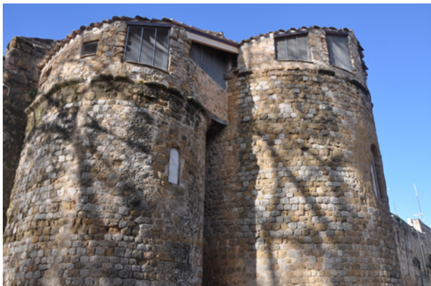
Fig. 4. Vista general de la capçalera