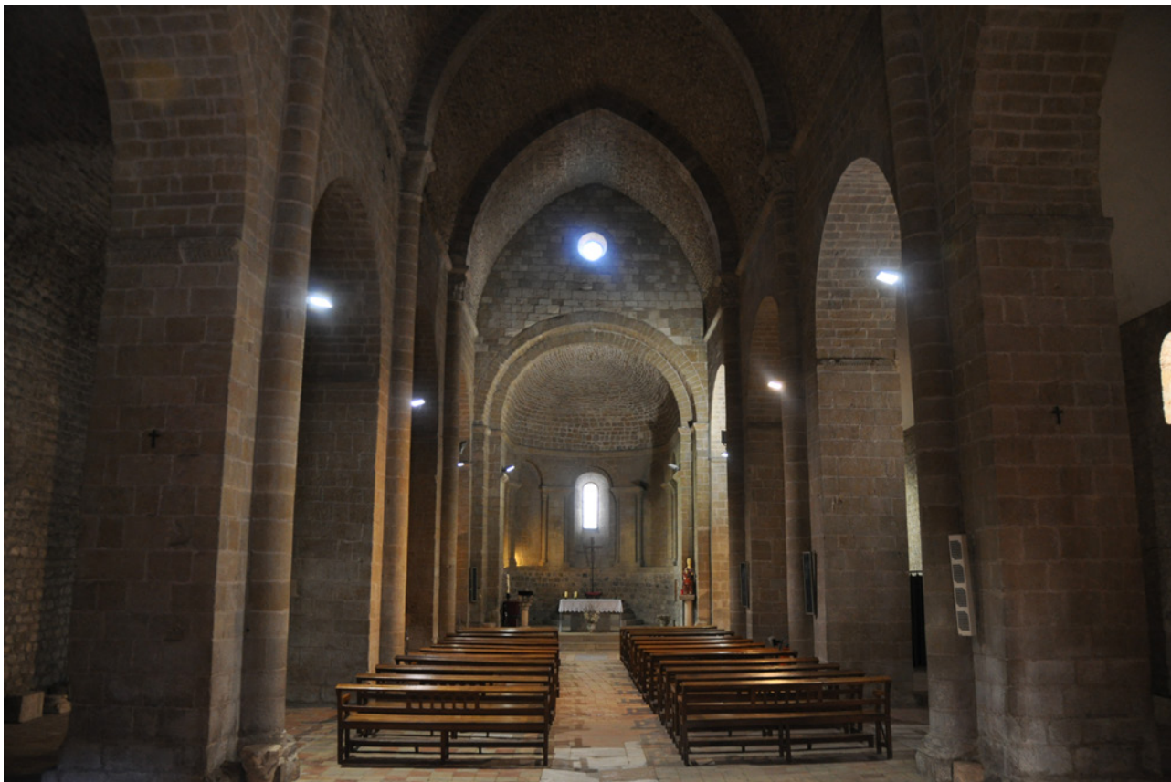
Fig.1. Vista general de l'interior de l'església

hagué un hospital situat a pocs metres a ponent de la portada d'accés al monestir, els murs del qual encara es conserven 17 .