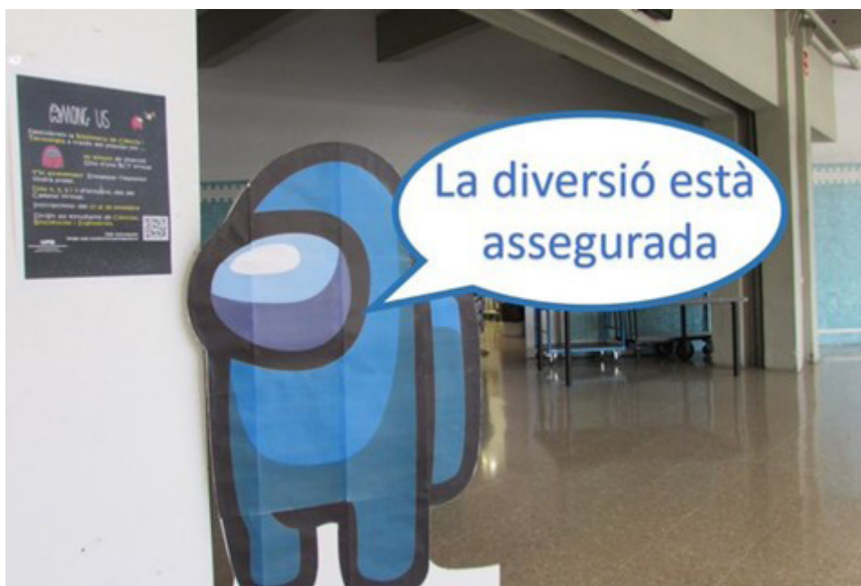
Imagen 9. Decoración de la BCT durante la campaña de difusión.

la comunicación con el resto de los participantes o, si procedía, con la biblioteca en caso de estancamien-