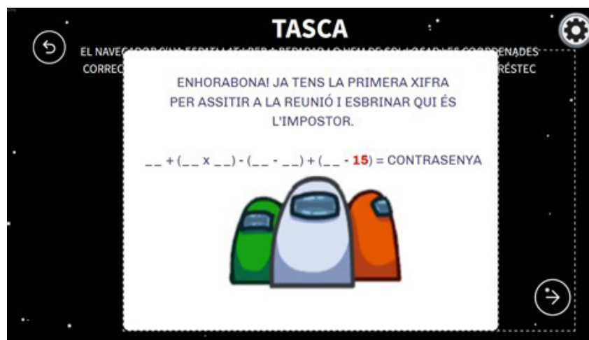
Imagen 2. Ecuación para completar a medida que se superan las pruebas/tareas