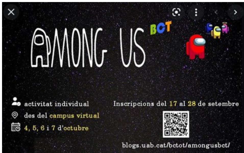
Imagen 8. Flyer de difusión de la actividad.

El juego se ejecutó del 4 al 7 de octubre, de 12:00 a 12:40. Los jugadores tenían que conectarse a