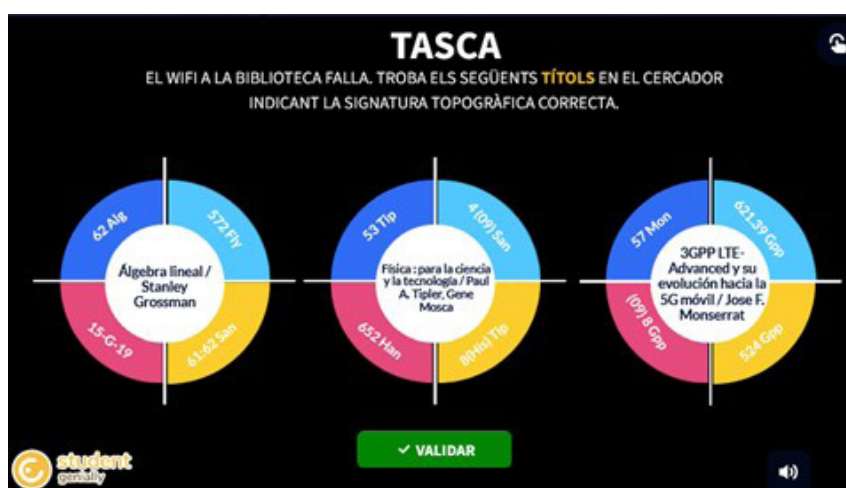
Imagen 1. Modelo de prueba

Con algunas diferencias, el juego recrea la misma narrativa que el Among Us original. El objetivo es encontrar al impostor que quiere boicotear la nave espacial-BCT evitando ser eliminado. Para desenmascararlo, los jugadores tienen que superar diferentes tareas/pruebas (imagen 1), cada una de ellas relacionada con los servicios de la BCT. La dinámica del juego consistía en la superación de dichas ta-