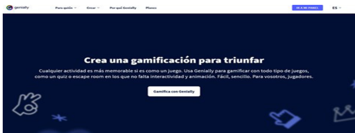
Imagen 6. Área de contenido gamificado de Genial.ly

ta con plantillas reutilizables con contenidos ludificados (imagen 6). De hecho, es donde encontramos la inspiración, y también la plantilla, para convertir nuestra biblioteca en una nave espacial y mantener la ambientación del Among Us.