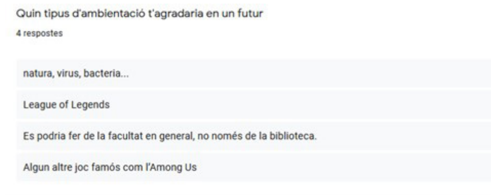
Imagen 11. Propuestas de los participantes por otras narrativas.

Ripoll, O. (2018) Gamificar les biblioteques. [Presentació a les 14es Jornades Catalanes d'Informació i Documentació 2018]. https://jocs.org/2018/05/10/gamificar-les-biblioteques