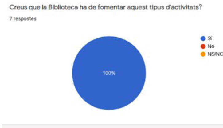
Gráfico 2. Datos sobre la actividad de la encuesta de satisfacción.

en manos de sus nuevos propietarios, han ido apareciendo por todo el Campus en forma de photocall .