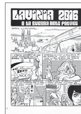
Il·lustració de Lavinia 2016 o la guerra dels poetes, d'Enric Sió

que els tornessin a admetre. Havia finalitzat l'etapa combativa d' Orifloma , que va acumular quinze expedients i segrests en sis anys.