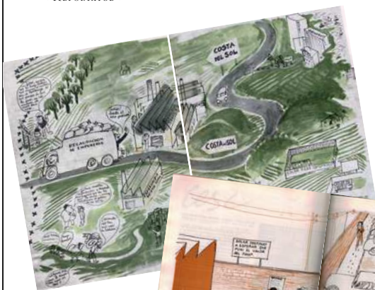
Doble pàgina censurada a Cesc el 1969 i la doble pàgina, també d'aquest autor, que va substituir la censurada.