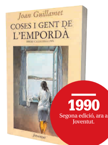
1990 Segona edició, ara a Jovenut.