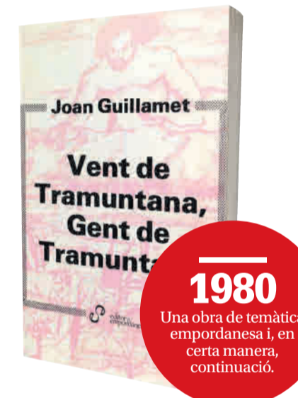
1980 Una obra de temàtica empordanesa i, en certa manera, continuació.