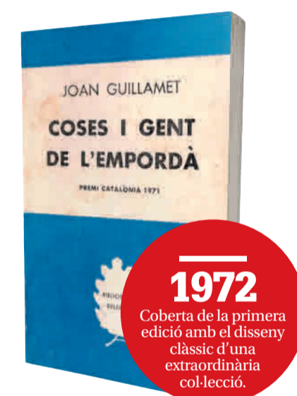
1972 Coberta de la primera edició a Selecta; l'obra havia guanyat el Premi Catalunya 1971.

paisatge i és així. Amb el lector en fa una conversa, seguida, com una continuació de les cròniques als diaris de Barcelona, de les descripcions gairebé costumistes del que li plau d'una terra espial en la que, terra i vent, configura, especialment en sentir-te al bell mig, per exemple en camins o corriols solitaris, entre conills i porc senglars, en un centre on l'infinit es fa proper, com al mar o al desert... No és estrany l'enamorament i les notables descripcions que Guillamet n'ha fet fins a ser definit gairebé com el cronista de l'Empordà i així ho reconeixen els premis que li han atorgat. O els retrets, pocs tanmateix. Només n'hi coneixem un, el del seu amic Ramon Guardiola quan el volia declarar persona non grata per criticar a Salvador Dalí, el qual volia fer els famosos museu només amb reproduccions i Guillamet ho va reprovar. Al final no fou així i al Museu Dalí hi ha, com calia, obra original. Guillamet és considerat, escrit i doncs, el que pensava, un dels millors escriptors sobre l'Empordà.