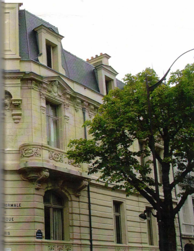
École Normale de Musique de Paris.