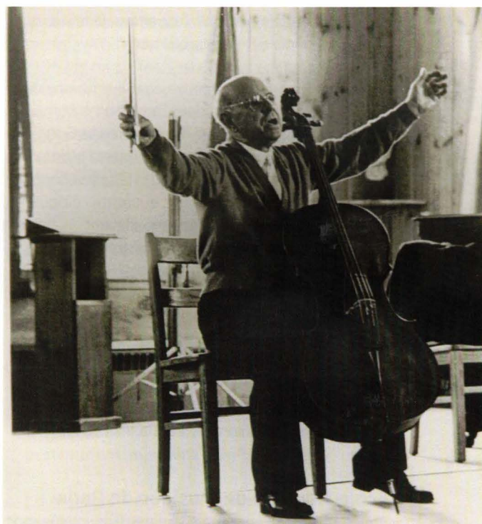
Pau Casals dirigeix una classe magistral a Marlboro (Estats Units)