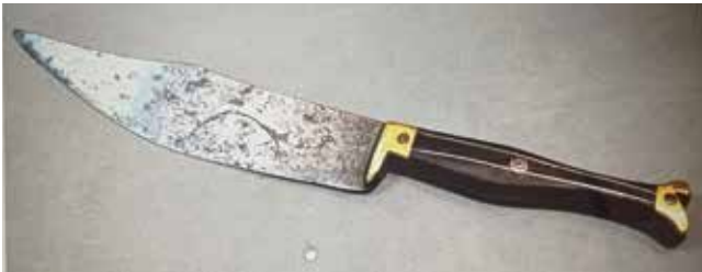
Ganivet de sabateta com els que portaven els processats.