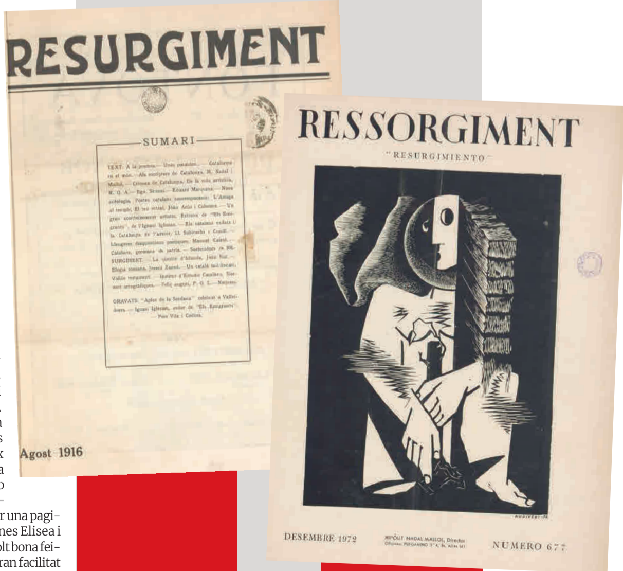
1916 Primer número de la revista «Ressorgiment».