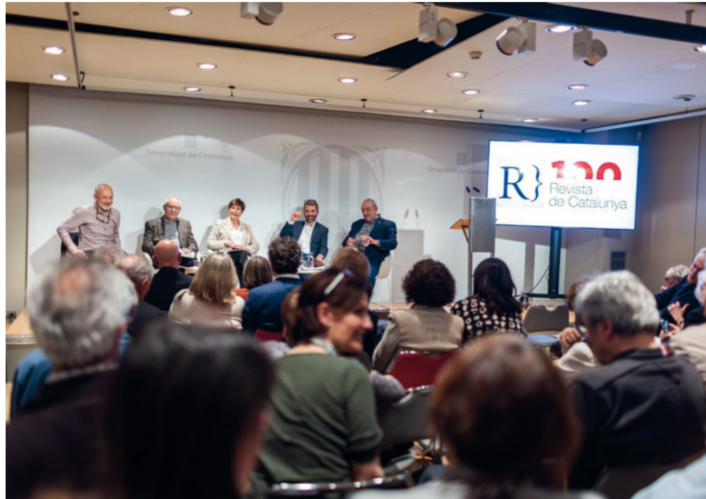
El 3 d'abril del 2024, la sala d'actes del Palau Robert de Barcelona va acollir el tret de sortida de l'Any Revista de Catalunya .

Són nous temps, ja no hi ha persecució del feixisme, però el país està afeblit a nivell identitari i la cultura catalana viu debilitada. La revista és de periodicitat mensual i la temàtica és àmplia i de gran nivell. Tanmateix, les crisis financeres