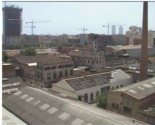
Imagen 1: el complejo de Can Ricart en l'actualidad.

Ciutat de Granada se encuentra otro ejemplo de aprovechamiento de antiguas estructuras: la reconversión de naves industriales en lofts. La mejor muestra es El Vapor Llull (Llull, 133), una empresa de productos químicos reconvertida en naves de residencia y trabajo, ocupadas normalmente por talleres de artistas, siguiendo el modelo del Soho de Nueva York. Otra muestra de lofts se encuentra en la calle Pallars, entre Ciutat de Granada y Roc Boronat, aunque en esta ocasión en construcciones de nueva planta. En la misma calle Pallars, en el tramo cercano a la rambla del Poble Nou, destaca un conjunto de muros repletos de grafitos. Los grandes espacios de las naves industriales también han sido aprovechados como discotecas, convirtiendo al Poblenou en una de las zonas de ocio nocturno de la ciudad. Y finalmente debemos destacar el complejo de Can Ricart como una de las piezas de mayor interés del patrimonio industrial del barrio.