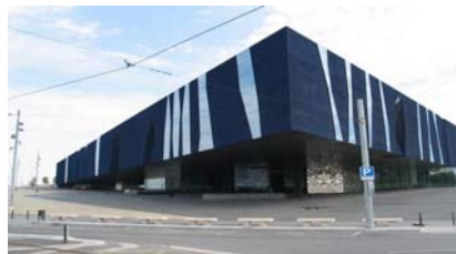
Imagen 6: Edificio del Fórum.