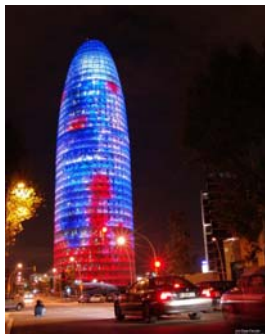
Imagen 5: Torre Agbar.

Significa crear un “nuevo” centro para una ciudad, incorporando un elemento que complementa la ciudad turística y de negocios que ya es Barcelona. No es casual que una de las imágenes que Barcelona vende en la actualidad sea la Torre Agbar, diseñada por Jean Nouvel. Sin duda, este edificio, una de las puertas de entrada del 22@, es un símbolo fruto del diseño de su construcción, de su forma de iluminarse y de la tecnología aplicada. Una Barcelona plenamente integrada al contexto social tecnológico que estamos viviendo. El triángulo de las puertas de entrada de esta “nuevo punto central estratégico” de Barcelona se complementa con el edificio del Fórum y con la estación del AVE de la Sagrera (en proyecto de construcción). El nuevo barrio del 22@ y la ciudad están incorporando e incorporaran en su imaginario colectivo estas tres imágenes más actuales, mezcla de tecnología, de negocio y de la arquitectura más actual.