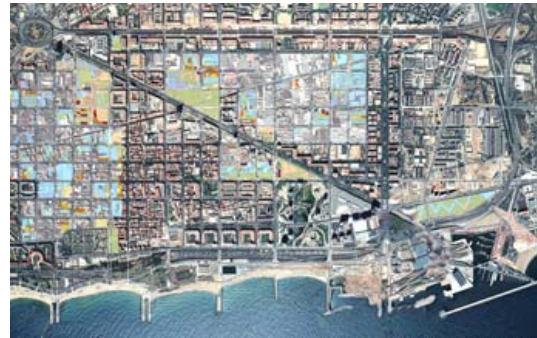
Imagen 4: mapa físico del 22@.

El 22@ no solamente se relaciona con la realidad virtual en este sentido. Como proyecto de renovación urbana y por tanto como plan urbanístico, transforma arquitectónicamente la ciudad y se transmuta con la clara intención de crear una nueva imagen del barrio, más “tecnológica”. Situando Barcelona en el contexto de las ciudades que apuestan por las tecnologías de la información y del conocimiento.