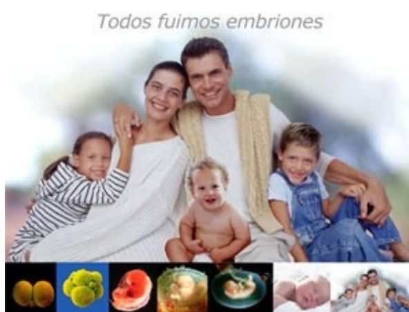
Ilustración 2: Campaña de la Conferencia Episcopal Española en contra de la investigación con células madre embrionarias, lanzada en marzo de 2005 con el lema “Todos fuimos embriones”. http://www.conferenciaepiscopal.es/dossier/iniciativas/embriones/default.htm

Una familia compuesta por dos progenitores –hombre y mujer– y tres hijos –dos niños y una niña, de diferentes edades–, todos ellos mirando al frente mientras sonríen, se sitúa bajo la frase “Todos fuimos embriones”. El más pequeño de los hijos, un bebé varón, está sentado sobre las rodillas del padre, quien, en actitud protectora, abarca con sus brazos al resto de miembros de la familia.