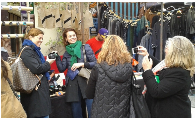
Figura 3. Las fotografías con productos y los selfies en las calles del mercado son constantes y vendrían a afirmar la importancia de la imagen y el denominado postureo. Enero 2016.

de explicar el fenómeno de atracción con el que cuenta el mercado, pero también, como veremos a continuación, de la fuerte carga de autoexplotación que es posible encontrar en el mismo.