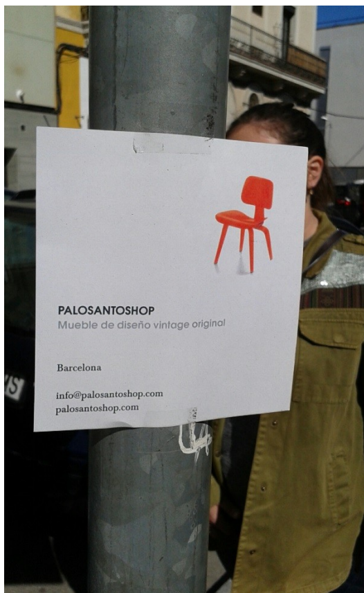
Figura 5. Afiches colgados en posters y paredes anunciando los muebles de PaloSantoShop. Febrero 2016.

Tal y como se ha señalado en párrafos anteriores, Palo Alto Market se encuentra situado en el antiguo barrio industrial del Poblenou. Aunque la zona sigue manteniendo un marcado carácter popular, la renta familiar disponible viene aumentando sin cesar a lo largo de los últimos años, aproximándose a la media de la ciudad de Barcelona —pasando de 89,8 a 95,4 en tan solo dos años (Departament d'Estadística de l'Ajuntament de Barcelona)— y convirtiendo al Poblenou en un espacio de y para las clases medias (Mansilla, 2015). Prueba de las transformaciones que vienen ocurriendo en la zona es la celebración del propio mercado de Palo Alto, o de la aparición, sobre todo en la zona sur del barrio, de un denso entramado artístico y cultural que encuentra acomodo en antiguas instalaciones industriales y comerciales de bajo precio, dando lugar a asociaciones como Poblenou Crea! o Poblenou Urban District , colectivo que cuenta con el objetivo de “impulsar la oferta cultural y comercial de la zona y promover el Poblenou como el nuevo distrito de arte y creatividad de Barcelona” (Poblenou Urban District, n.d.). Aunque la relación entre incrementos del valor del suelo, desplazamientos socio-espaciales o la mercantilización del espacio con actividades de carácter cultural y artístico