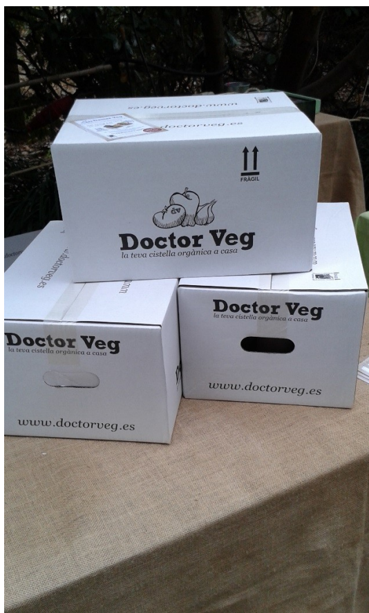
Figura 2. Cajas exhibidas en alguna de las paradas que ocupan las calles internas de Palo Alto Market con productos dirigidos a un público vegano. Marzo 2016.

o Beach Market , siempre en inglés). Sin embargo, y pese a la imagen que la propia organización se encarga de proyectar a través de los medios y las redes sociales, los individuos y grupos que pude observar en mis visitas a Palo Alto no me permitirían establecer un patrón o destacar alguna característica especial entre los mismos, aunque si tuviera que destacar alguna, podría citar la edad —en torno a los 30 años— como posible pauta. Si, por un lado, los vendedores y vendedoras de los diferentes tenderetes establecidos a lo largo y ancho del recinto mantienen cierta estética común —quizás ésta sí más cercana a las proyecciones de la organización—, por otro lado, esto no es así con respecto al público asistente, que podría trasplantarse a cualquier calle de la ciudad y pasar desapercibido. En definitiva, la indiferenciación es absoluta (CC, cuaderno de campo, 02/01/2016), aunque como me indicó otra de las personas entrevistadas, el público “ahora está más mezclado, pero en un prin-