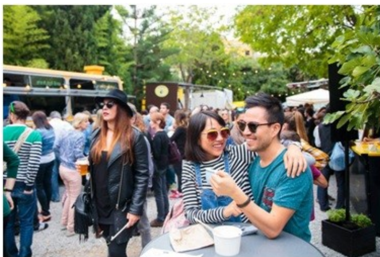
Figura 1. Gente guapa y feliz, de diversos orígenes y colores, jóvenes siempre, vestidos a la moda y que se detienen en las paradas o conversan alegres y ajenos a las preocupaciones de la vida.

como me señaló la pareja anterior (E2, entrevista personal, 07/02/2016), “no cualquiera puede entrar, hay que tener características especiales, en tema de estética y gastronomía. Hay que ser vintage , tener el carnet de hipster 12 ” (ej., Ver figura 1). Nos encontramos aquí con una vinculación clara del concepto de distinción del que nos hablara Bourdieu (1979/1998; Bourdieu y Chartier, 2011), por cuanto son los organizadores del evento, recordemos, miembros de una familia de la burguesía valenciana asentada en Barcelona (Escuela de Arte, 2000), quienes establecen estos criterios, acumuladores como son de un alto capital simbólico y económico, y capaces, por tanto, de ejercer el papel de dominadores en el campo del consumo de mercado en Barcelona. Esta característica se ve reforzada por algunas expresiones recogidas en las entrevistas, como aquel informante que señaló que el carácter de Palo Alto no podía ser de otra manera “siendo quienes son quienes lo organizan [...] burguesitos de Pedralbes que vienen a encanallarse al Poblenou” (E5, entrevista personal, 23/09/2016).