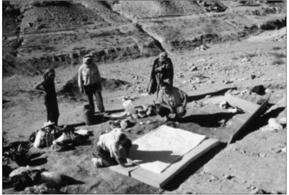
Treballs al jaciment excavat a l'alta vall del riu Eufrates.

Els treballs de camp realitzats durant els mesos de setembre i octubre d'enguany, per part d'un equip format per catorze investigadors, han constituït una nova oportunitat per a