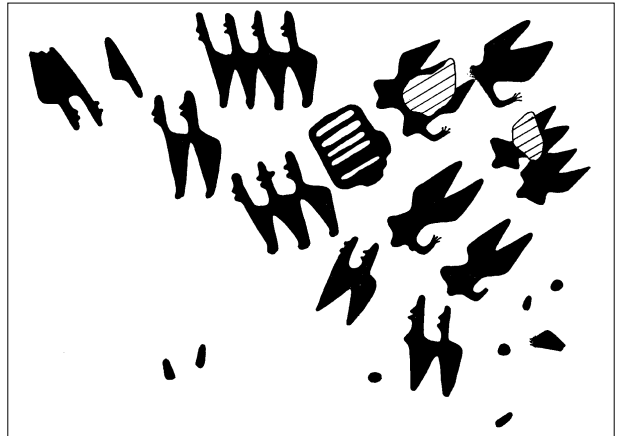
Esquema de les representacions humanes pintades.

L'excepcionalitat de la troballa va motivar una ràpida i efectiva actuació de l'Institut del Patrimonio Histórico Español, que amb la mediació de l'Ambaixada d'Espanya a Damasc va possibilitar el desplaçament d'una tècnica en restauració i extracció d'aquest tipus de documents artístics. Les tasques de consolidació i d'extracció de les pintures, realitzades la segona quinzena d'octubre, van permetre el trasllat de les representacions pictòriques al Museu Nacional d'Arqueologia d'Alep (Síria).