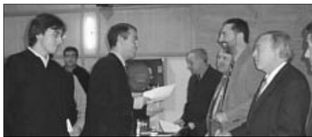
Un moment de l'acte de lliurament de diplomes als alumnes de la Facultat de Ciències Econòmiques i Empresariales.

Solé Tura, en la seva intervenció, va insistir en el fet que és impossible preveure quin serà el model polític que hi haurà a l'Europa comunitària del futur. No obstant això, va remarcar la importància del paper que han de fer les regions i les ciutats en la integració europea. Seguint aquesta línia, va explicar que «els qui porten la negociació de la Unió Europea (UE) són els estats, tot i tenir estructures polítiques molt diferents. No tenen, per exemple, el mateix potencial estats com Alemanya o França, que Bèl-