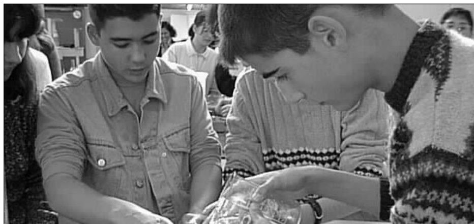
Una de les nombroses activitats que van tenir lloc al campus de la UAB en el transcurs de la Setmana de la Ciència.

La Universitat Autònoma de Barcelona ha participat en la segona edició de la Setmana de la Ciència, que va tenir lloc del 13 al 27 de novembre, organitzant i oferint activitats molt diverses: des de visites guiades pels diferents centres de la Universitat fins a representacions teatrals o projeccions cinematogràfiques.