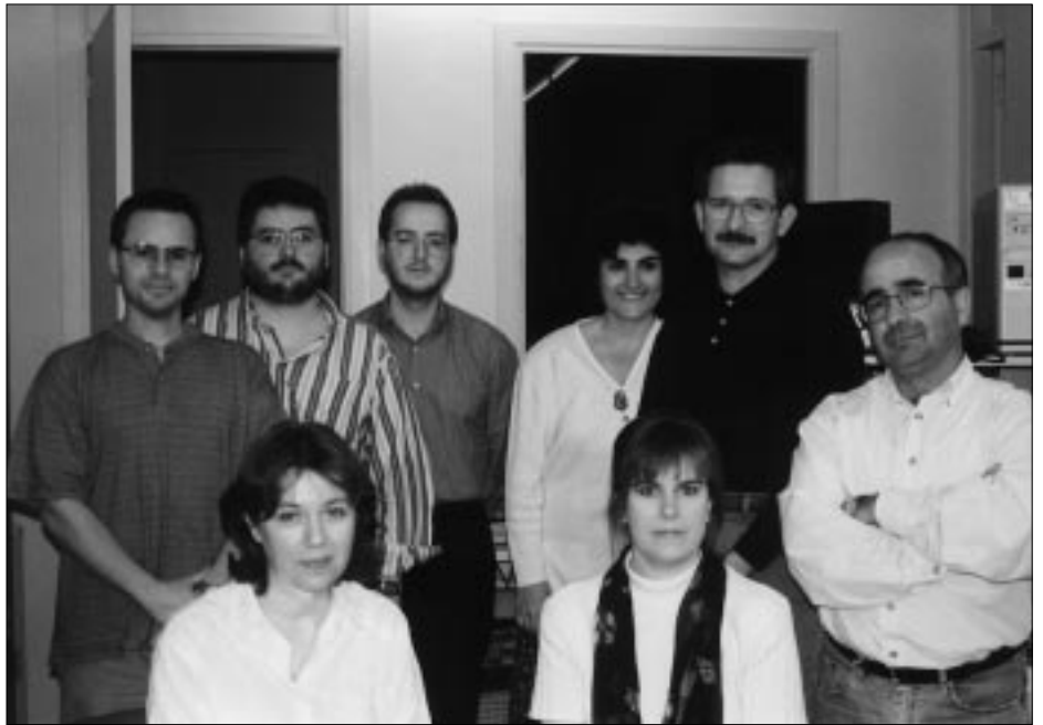
L'equip d'investigadors que desenvolupa el projecte des del 1994.

En aquesta línia, una de les idees que enguany acapara l'atenció dels especialistes és la que un conjunt relativament petit de variables cognoscitives (creences, expectatives i atribucions), moltes vegades de caràcter automàtic, determinen en gran manera tant el tipus de reaccions emocionals i fisiològiques davant de les situacions d'estrès, com el curs d'acció que l'individu du a terme per intentar superar l'esmentat estrès, la qual cosa es denomina l'estratègia d'afrontament.