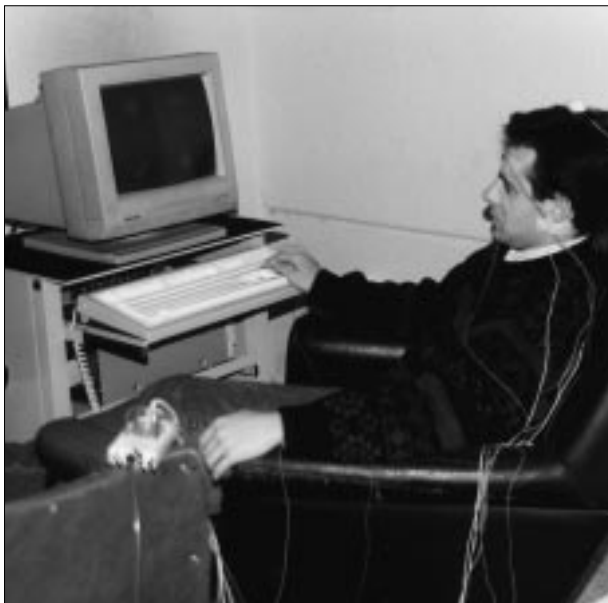
Un dels experiments que es realitza al laboratori.

Pel que fa a treballs de camp, s'ha estudiat l'eficàcia de diferents tècniques psicològiques per disminuir l'ansietat davant les intervencions quirúrgiques i facilitar la recuperació posterior. Així mateix, ja s'ha finalitzat un treball que demostra la importància predictiva de les expectatives de l'autoeficàcia en l'adherència a les prescripcions mèdiques en malalts cardiovasculars. Finalment, estan en marxa alguns estudis sobre la relació entre competència percebuda i adaptació a l'estrès, sigui provocat per l'estat de salut (en concret, en pacients de càncer) o per circumstàncies laborals (docents d'ensenyament primari i secundari).