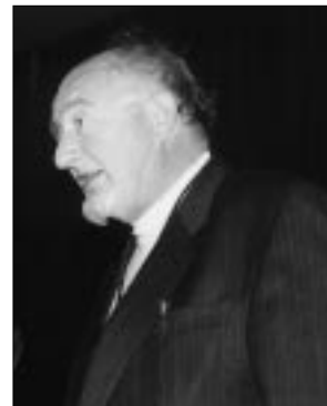
El paleontòleg suís Lukas Hottinger, investit doctor honoris causa .

En cloure l'acte d'investidura, el rector, Carles Solà, va ressaltar la rellevància del Departament de Geologia en l'endegament dels estudis de ciències del medi ambient en aquests temps de canvis a la universitat.