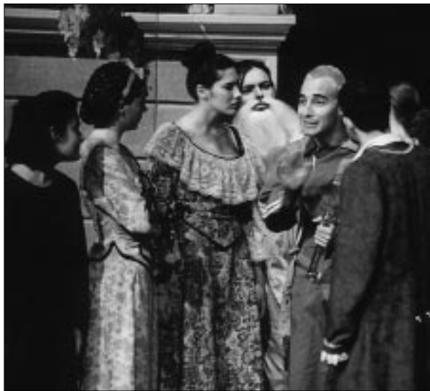
Els figurants discutint què cal fer amb el protagonisme conquerit.