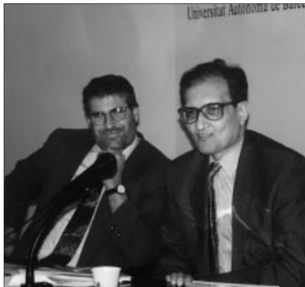
Amartya Sen va oferir una interessant conferència.

ara mateix inexistent, d'escollir entre diferents alternatives.