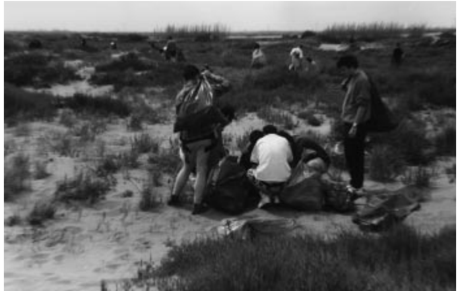
Un grup de cinquanta objectors de consciència de l'Autònoma van fer el cinquè curs de formació a Deltebre, on, durant un cap de setmana de maig, van fer diferents activitats, com ara la netja de la platja del Fangar i les visites a l'Ecomuseu i la cooperativa arrossera. Moviment per la Pau va exposar el model de defensa que ha elaborat, i es va debatre sobre el model que prepara l'Estat espanyol.

L'Escola de Pràctica Jurídica ha començat a organitzar mobilitzacions, com la que va dur uns setanta estudiants a manifestar-se davant el Col·legi d'Advocats de Barcelona, el 30 de juny. El degà, Jaume Alonso-Cuevillas, es va mostrar partidari que l'ordre no tinguí efectes retroactius i que no s'exigeixi als que ja estan matriculats en escoles de pràctiques.