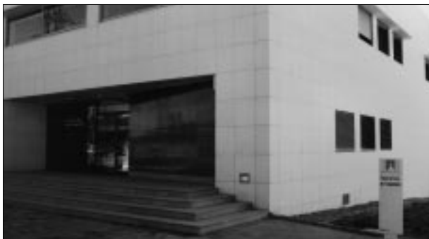
Instal·lacions del Centre de Visió per Computador.

Actualment s'està treballant en dues vies de continuació. D'una banda, l'estudi de nous estímuls visuals útils per a l'enfocament i relacionats amb el color. Aquest estímul, molt poc estudiat fins ara, podria ser crític en circumstàncies on d'altres són inoperants, com per exemple objectes que presentin poca textura visual. De l'altra, s'està estudiant la integració dels processos oculars bàsics en la plataforma de visió antropomòrfica. Aquesta plataforma està formada per un sistema robotitzat amb cinc graus de llibertat que imiten els moviments d'un cap i per dues càmeres de CCD amb òptiques motoritzades que permeten el control de l'enfocament, l'obertura i el zoom. Les possibilitats mecàniques d'aquesta plataforma, que s'acosten molt a un model antropomòrfic, són una bona base per al desenvolupament de sistemes de visió actius, útils en problemes com la conducció automàtica de vehicles, el control del trànsit o la vigilància. Però, per ser operatius, cal tenir-ne resolts el control a nivell ocular de manera independent de l'aplicació. És a dir, cal que el sistema sigui capaç d'obtenir automàticament imatges enfocades, de mantenir la vergència de les dues càmeres, d'ajustar el seu iris a les condicions d'il·luminació i d'estabilitzar la seva mirada en els objectes. La integració de tots aquests processos en un únic esquema de control, guiat pels estímuls visuals, continua sent un tema apassionant de recerca, necessari per construir sistemes visuals artificials.