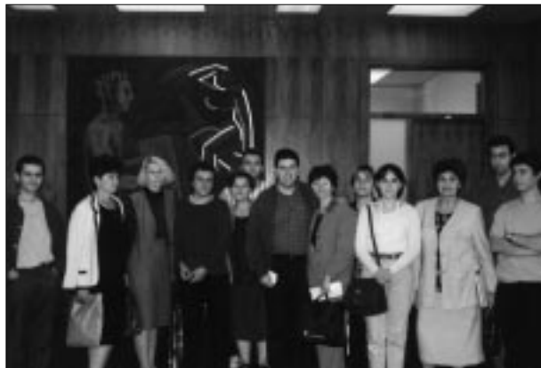
El rector va rebre les professores bosnianes.

Aquesta ha estat la primera experiència d'aquest tipus i ha rebut el suport del Comissionat per a Universitats i Recerca i el Centre Unesco de Catalunya.