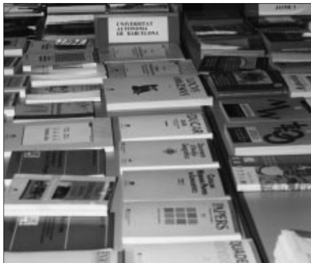
Exposició de llibres i revistes de les universitats de l'Institut Joan Lluís Vives a la Biblioteca d'Humanitats.