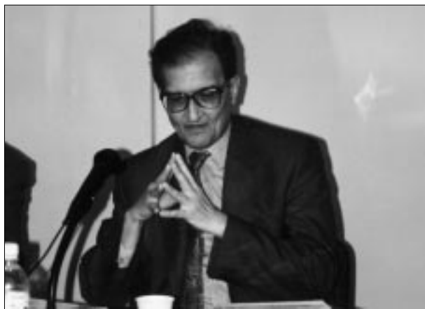
Amartya Sen, en un moment de la conferència que va fer, el maig passat, a la Facultat de Ciències Econòmiques i Empresarials.

Amartya Sen, economista guardonat amb el Premi Nobel d'Economia 1998, i Premi Internacional Catalunya 1997, va participar en el curs The Philosophical Foundations on Normative Economics, que va organitzar la UAB a Venècia els darrers dies del mes d'agost passat, en el marc de la Venice International University, amb cinquanta-dos participants vinguts de tot el món.