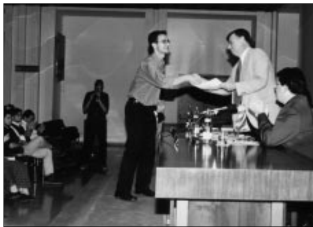
Instantània de l'acte de reconeixement als voluntaris de la UAB.