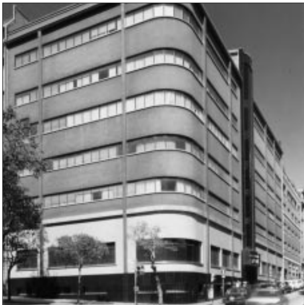
Edifici de l'Institut Universitari Barraquer a Barcelona.

El seu fill, Ignasi Barraquer (1884-1965), va continuar investigant i va revolucionar la cirurgia ocular amb la nova tècnica de la facoèresi, adoptada per les principals escoles oftalmològiques estrangeres. Sota el lema «Tractem el pacient com voldríem que ens tractessin a nosaltres», Ignasi Barraquer va inaugurar, l'any 1941, el Centre d'Oftalmologia Barraquer, a Barcelona, que va aconseguir el nivell científic i tecnològic més alt del moment. Aquest lema constitueix encara avui dia la norma de conducta professional del centre.