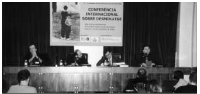
Un moment dels debats de la Conferència Internacional sobre Desminatge.

D'aquesta manera, la UAB pretén, amb aquest cicle de conferències, donar a conèixer la greu problemàtica de les mines antipersona, sensibilitzar la ciutadania sobre aquesta situació, convidar a la reflexió sobre la necessitat del desminatge als països afectats, i presentar propostes i models eficaços per a l'eradicació d'aquest problema. Un problema que causa una víctima cada vint minuts,