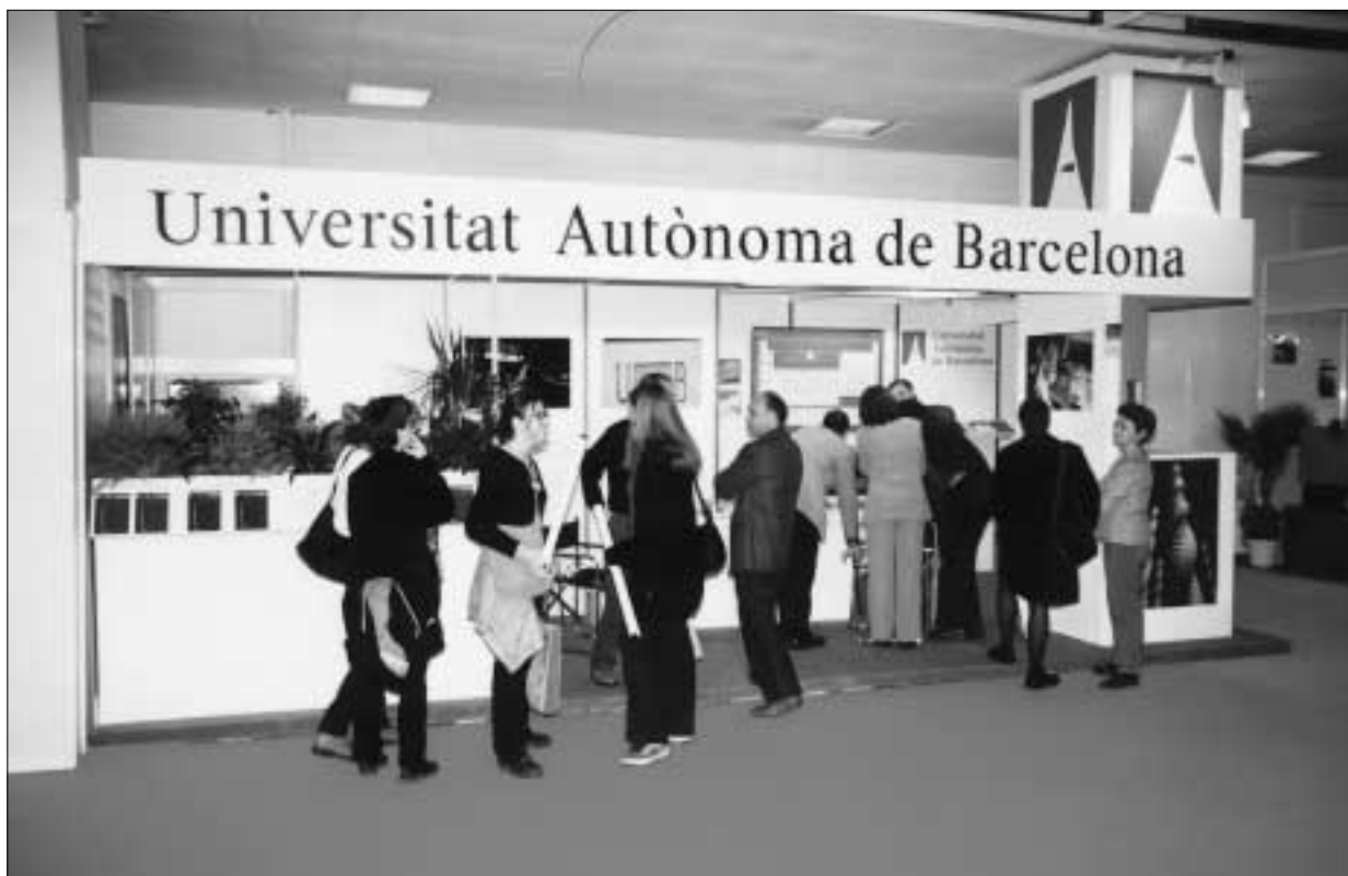
Estand de la UAB a Expoquímica.

L'exposició també va oferir informació sobre els estudis relacionats amb la química que es poden cursar a la UAB, així com també un accés en línia al nou web de la Universitat Autònoma de Barcelona.