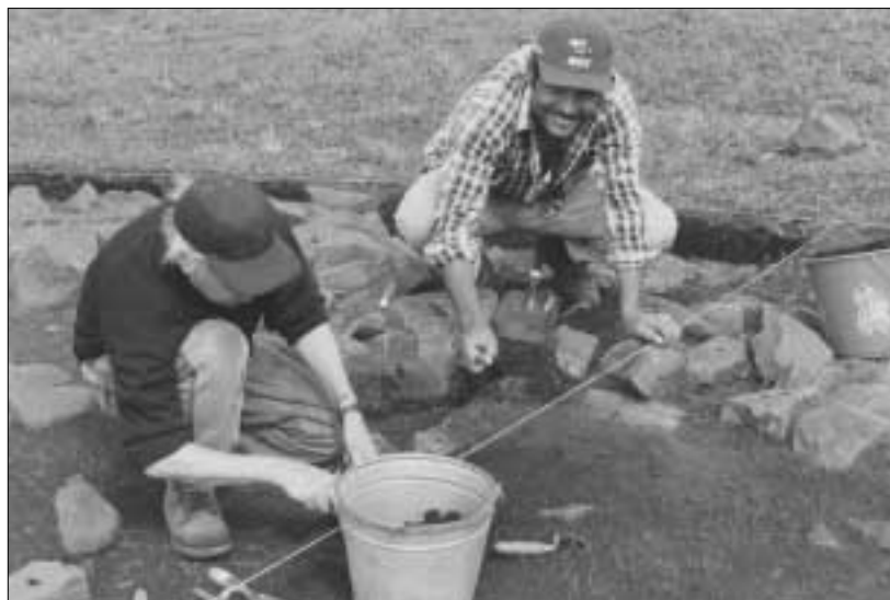
Les excavacions a Nicaragua

Els responsables nicaragüencs i catalans remarquen la importància del projecte, tant per les raons exposades com per l'oportunitat de donar continuïtat –en l'àmbit de la investigació– a unes relacions que van iniciar el 1996 amb un conveni de col·laboració per al desenvolupament d'una llicenciatura d'Arqueologia a la UNAN-Managua, que ha tingut, des dels seus inicis, el suport de la Fundació Autònoma Solidària.