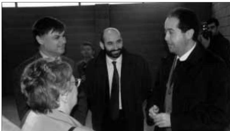
El conseller de Medi Ambient, Felip Puig, a la inauguració de la deixalleria.

teries, etc.), que requereixen un tractament específic i un control periòdic. La nova instal·lació forma part de la xarxa de l'Entitat Metropolitana de Serveis Hidràulics i Tractament de Residus, però la seva ubicació al campus universitari està definida pel programa Residu Mínim de la UAB.