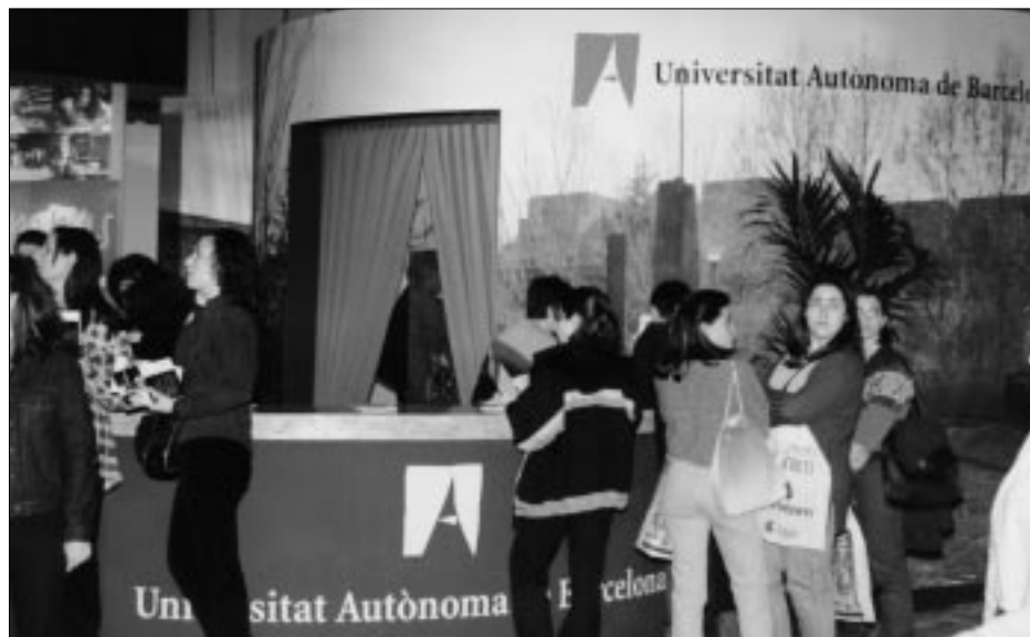
El Saló de l'Ensenyament va ser visitat enguany per més de vuitanta mil estudiants, dels quals uns quants milers van passar per l'estand de la Universitat Autònoma de Barcelona.

La Universitat Autònoma de Barcelona va estar representada un any més al Saló de l'Ensenyament, que va tenir lloc del 18 al 21 de març passat, amb un estand informatiu al Palau 6 del recinte firal de Montjuïc. L'estand de la UAB volia mostrar el campus de Bellaterra, format per una comunitat de prop de quaranta mil persones, amb excel·lents infraestructures docents i d'investigació, els serveis bàsics per als estudis, i totes les instal·lacions que ofereix una ciutat universitària: esportives i sanitàries, residències, establiments comercials i culturals, etc.