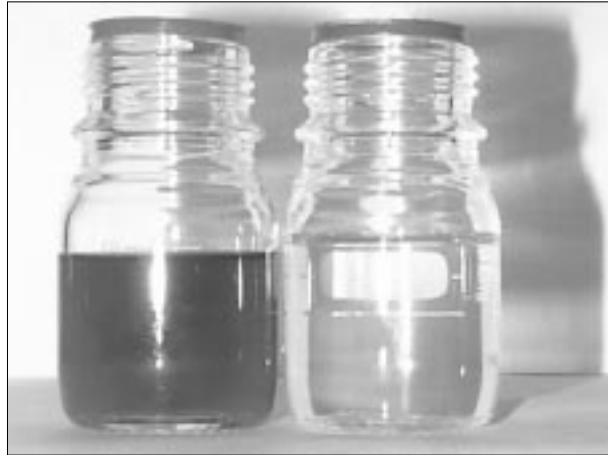
Aigües residuals d'indústria tèxtil abans (esquerra) i després (dreta) del tractament amb el Trametes versicolor .

Els investigadors, que ja havien obtingut resultats satisfactoris en la decoloració i la reducció de la toxicitat en efluents de la indústria paperera, han utilitzat per primer cop un bioreactor d'aire polsat a escala de laboratori per al tractament dels efluents tèxtils. La tècnica d'alimentació d'aire en forma de polsos permet