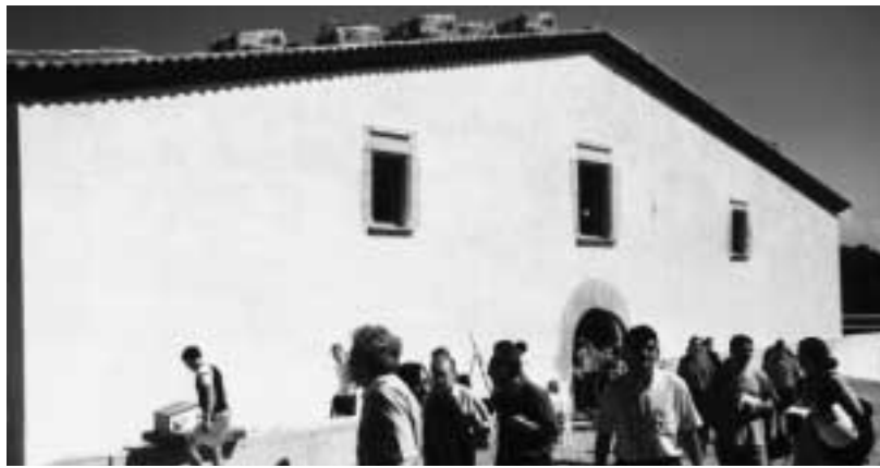
Professors i alumnes el dia que van cloure el curs dedicat a la restauració de la Masia Can Miró.

Els alumnes participants en aquest projecte han passat durant aquests dos anys per diferents cicles formatius i van distribuir-se en diferents mòduls que inclouen, entre d'altres especialitats, els de fusteria de taller; pintura/estucat; jardineria i fontaneria.