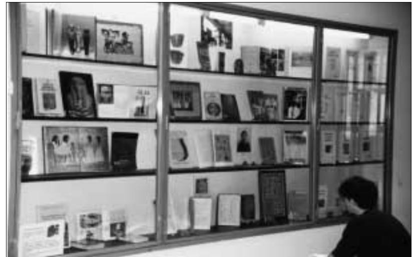
Una de les vitrines de l'exposició de la pedra de Rosetta.

so (fonograma). Va costar-li 16 anys desxifrar la totalitat del text que conté aquesta pedra de basalt negre. L'escrit, que data de l'any 196 abans de Crist es troba en tres versions diferents gravades a la pedra: hi ha 14 línies de jeroglífic, 22 línies de demòtic i 54 línies de grec.