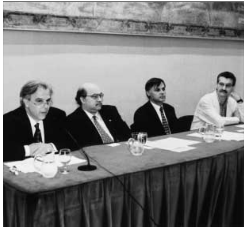
El coordinador de Cultura per la Pau de l'UNESCO, René Zapata, el comissionat per a Universitats i Recerca, Andreu Mas-Colell, el rector, Carles Solà, i el titular de la càtedra UNESCO, Vicenç Fisas.

L'inici d'aquestes activitats coincideix amb dues proclamacions de l'Assemblea General de Nacions Unides: la de l'any 2000 com Any Internacional de Cultura de Pau i la declaració de la dècada 2000-2010