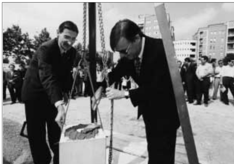
L'alcalde de Sabadell Antoni Farrés, i el rector de la UAB, Carles Solà, en l'acte de col·locació de la primera pedra del nou edifici que acollirà la Fundació per a les Indústries de la Informació i de la Comunicació.

La Fundació Indústries per a la Informació, integrada per la UAB, l'Ajuntament de Sabadell, i les empreses Prisa, Ericsson, Fundació Arecos i Banc de Sabadell, crearà i impulsarà la formació de gestors de les