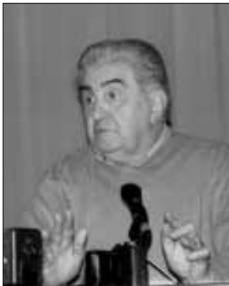
Eduardo Haro Tecglen.

Eduardo Haro Tecglen, columnista del diari El País , va ser el protagonista d'un dels col·loquis sobre l'actualitat que ha preparat el Departament de Periodisme i de Ciències de la Comunicació de la UAB per a aquest segon semestre. L'acte va tenir lloc el 16 de març, a l'aula magna de la Facultat de Ciències de la Comunicació, que es va omplir d'alumnes que volien escoltar el periodista.