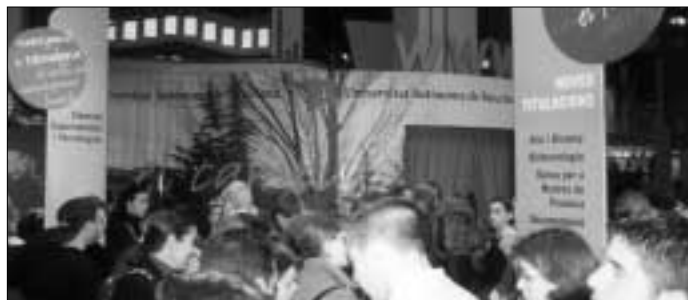
La UAB va ser present al Saló de l'Ensenyament.

Amb el lema Una universitat per viure-hi , la Universitat Autònoma de Barcelona va participar en l'onzena edició del tradicional Saló de l'Ensenyament. Aquesta cita obligada del món de l'ensenyament va tenir lloc entre els dies 23 i 26 de març, al Palau 8 de la Fira de Barcelona.