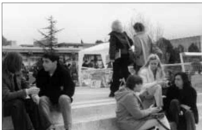
Alumnes de centres de secundària de tot Catalunya van visitar la UAB en la Jornada de Portes Obertes, en què se'ls va mostrar les instal·lacions i les possibilitats de diversos estudis que poden dur a terme a l'Autònoma.

En total, van venir 24.000 estudiants de tot Catalunya, amb 350 professors de secundària. Per facilitar la visita del campus es van habilitar «quatre busos» turístics que feien quatre itineraris diferents pel campus. Estudiants de turisme explicaven als futurs universitaris les peculiaritats del campus universitari de Bellaterra. Les diferents associacions d'estudiants que van organitzar les ac-