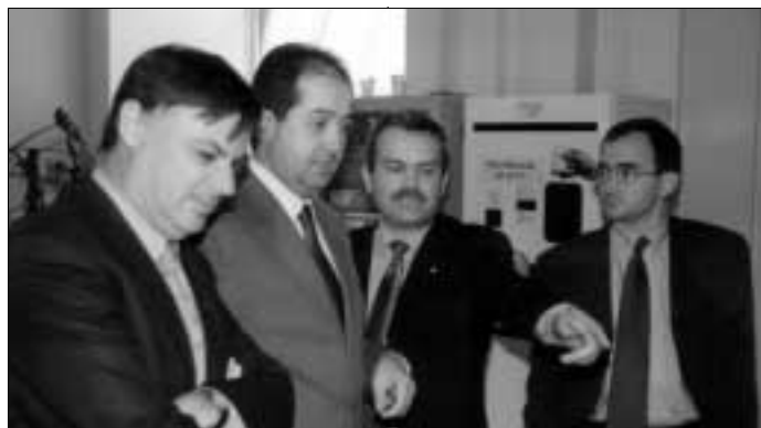
El vicerector de Campus i de Qualitat Ambiental, Manel Sabés, mostra al conseller de Medi Ambient, Felip Puig, el funcionament de les màquines automàtiques de serveis i de comerç just.

Aquesta acció s'emmarca dins d'un projecte més global: el Projecte Residu Mínim. El projecte, començat l'any 1995, va ser l'inici de tot un