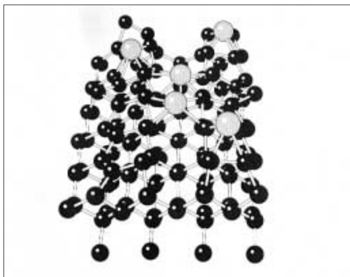
Simulació, mitjançant el programa SIESTA, de la combinació de dos materials (tritanat de bari i silici) per a la construcció d'un transistor.

El programa desenvolupat pels investigadors de l'Icmab i els seus col·la-