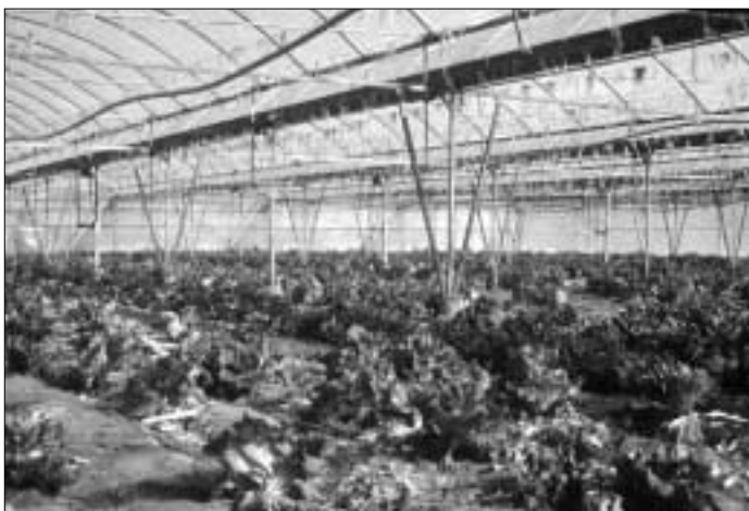
Hivernacles d'Almeria en què s'utilitzen pesticides.

L'exposició contínua a pesticides ha estat considerada un important factor de risc que augmenta les possibilitats de patir diversos tipus de càncer, com la leucèmia o el càncer de bufeta, i diverses malalties genètiques. En diversos estudis desenvolupats a França, als Estats Units i a Escandinàvia, s'ha constatat que la incidència d'aquestes malalties en els agricultors