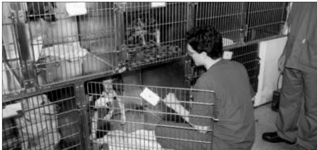
Gossos en tractament a l'Hospital Clínic Veterinari.

L'Hospital Clínic Veterinari de la Universitat Autònoma de Barcelona ha complert deu anys d'existència. D'ençà de la seva inauguració, el 1990, ha anat creixent en serveis, personal i equipaments, i el nombre de consultes que ha hagut de fer ha augmentat considerablement. Una dada: l'any 1990 va atendre 700 casos; l'any 1999 en va atendre gairebé 12.000.