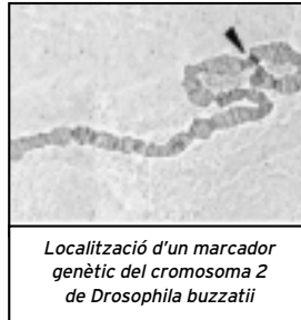
Localització d'un marcador genètic del cromosoma 2 de Drosophila buzzatii

les variacions genètiques que han permès als individus de la seva mateixa espècie obtenir avantatges evolutius.