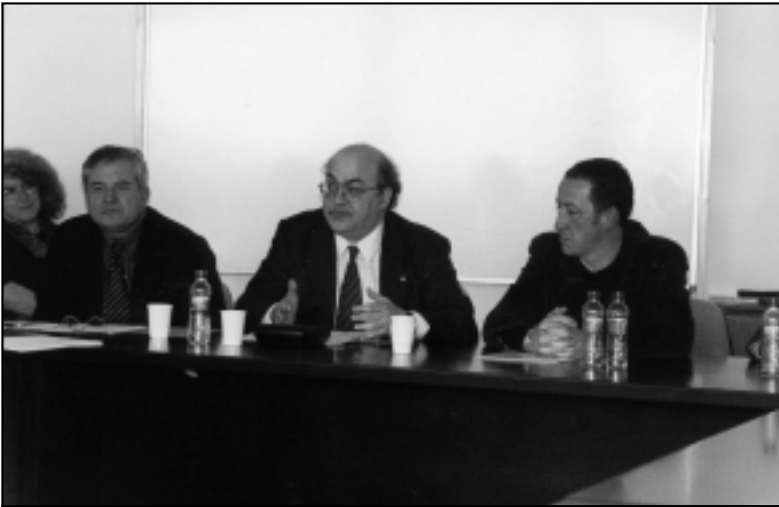
Andreu Mas-Colell, en la clausura de les jornades.