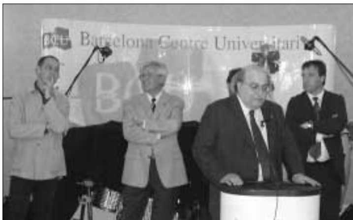
El rector de la UAB, l'alcalde de Barcelona i el conseller Mas Colell, el dia 3 de juny, en la benvinguda als estudiants Erasmus a Pedralbes.

Pel que fa als estudiants Erasmus, Itàlia és el primer país d'origen (24 %), seguit d'Alemanya (18,7 %), de França (15,3 %), de Portugal (8 %) i del Regne Unit (5 %), d'on ha tornat a augmentar el nombre d'estudiants vinguts després d'uns anys de recessió. Per centres i amb les dades actuals, la Facultat de Filosofia i Lletres ha rebut 216 estudiants; la de