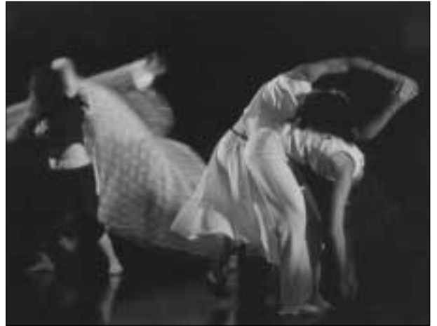
Un espectacle de dansa va posar el punt final a la celebració de l'Any de les Llengües a la UAB el 4 de juny.

El Cicle de Conferències sobre Llengua, Coneixement i Creativitat s'ha vertebrat entorn de temes molt generals: en què consisteix el coneixement lingüístic, la importància so-