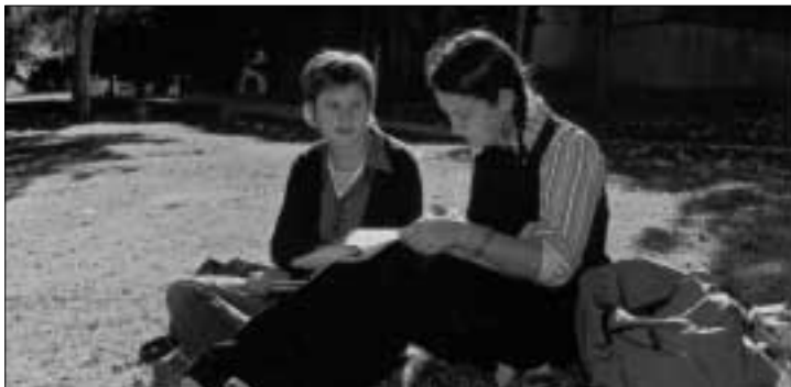
Els cursos de la Universitat d'Estiu es fan al campus de Bellaterra.

Per vuitè any consecutiu, la UAB organitza, durant tot el mes de juliol, la Universitat d'Estiu, amb la presentació d'una oferta d'activitats en cinc àmbits temàtics que abasten cultura i societat; medi ambient, salut i qualitat de vida i estudis tècnics, tots ells gestionats per l'Institut de Ciències de l'Educació (ICE). També s'impartiran cursos d'idiomes, dels quals és responsable el Servei d'Idiomes Moderns (SIM), i d'activitat física, dels quals es fa càrrec el Servei d'Activitat Física (SAF).