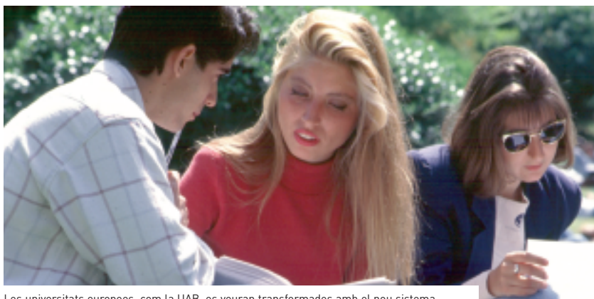
Les universitats europees, com la UAB, es veuran transformades amb el nou sistema.

Aquest és un projecte ambiciós que recull i potencia el testimoni de l'antic Programa de Suport a la Innovació Docent Universitària (PSIDU), amb la finalitat d'homologar totes les titulacions actuals al tipus de crèdit europeu i situar la UAB en els llocs més alts de les universitats del vell continent. L'IDES actuarà sobre dos grans eixos: l'adaptació del sistema de crèdits i la formació per a la