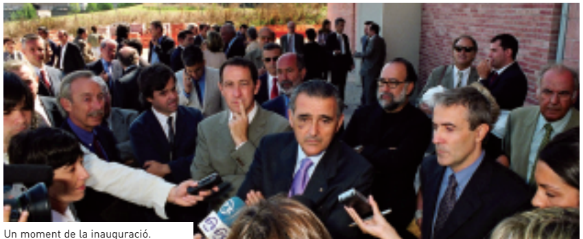
Un moment de la inauguració.

El nou edifici, situat al costat de la Facultat de Veterinària, disposa de barres de contenció de microorganismes amb un nivell de bioseguretat 3. Això farà possible investigar amb agents patògens greus i causants de malalties animals. Es tracta del primer edifici amb aquestes característiques de bioseguretat que es construeix a Catalunya. L'objectiu del