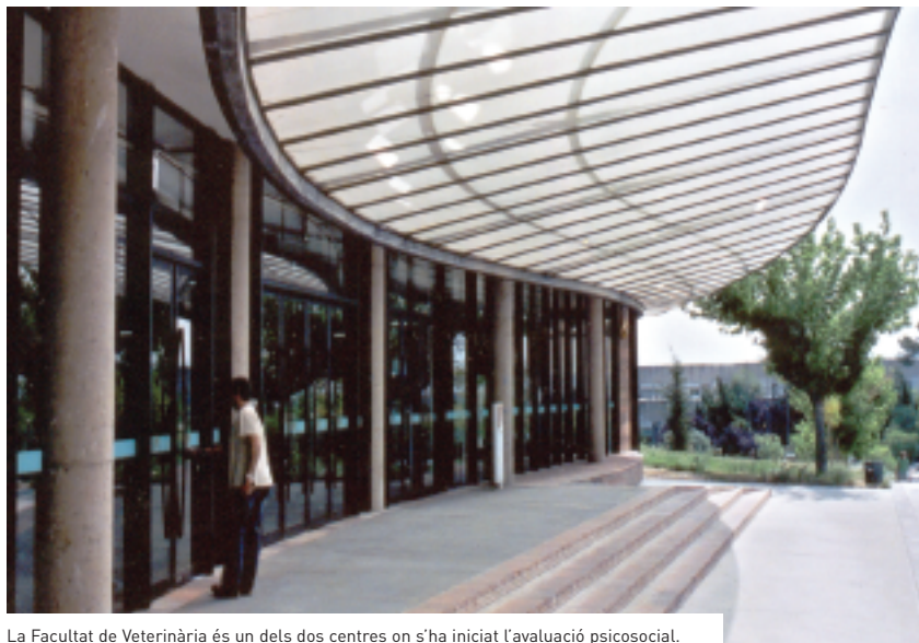
La Facultat de Veterinària és un dels dos centres on s'ha iniciat l'avaluació psicosocial.