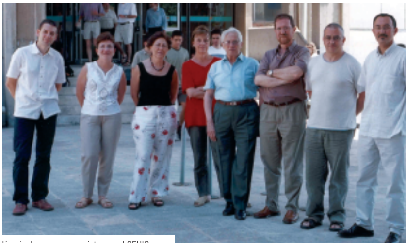
L'equip de persones que integren el CEHIC.

La relació amb el Departament de Filosofia, al qual està adscrita l'Àrea d'Història de la Ciència, és especialment estreta, com també ho és amb la Facultat de Medicina, on hi ha la Unitat d'Història de la Medicina.