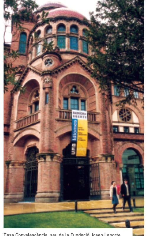
Casa Convalescència, seu de la Fundació Josep Laporte.