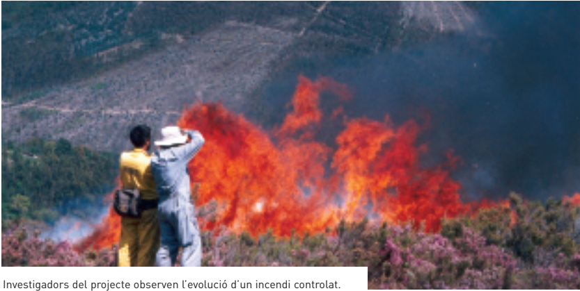
Investigadors del projecte observen l'evolució d'un incendi controlat.