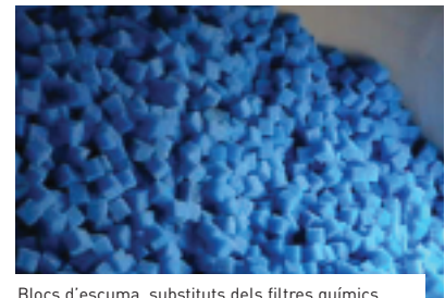
Blocs d'escuma, substituïts dels filtres químics.