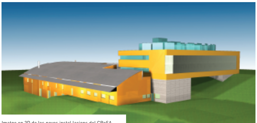
Imatge en 3D de les noves instal·lacions del CReSA.

El nou edifici del CReSA s'ha construït per investigar al més alt nivell i amb la màxima seguretat. Consta de tres zones: una unitat de biocontenció amb nivell de bioseguretat 3, una altra amb un nivell de bioseguretat 2 i una zona administrativa. L'edifici té laboratoris d'alta seguretat on es podran investigar aspectes com la virologia, la bacteriologia, el cultiu cel·lular, la immunologia i la biologia molecular. Les noves instal·lacions consten també de sales d'alta seguretat per fer-hi inoculacions experimentals i per albergar-hi porcs, vedells, aus i altres espècies.