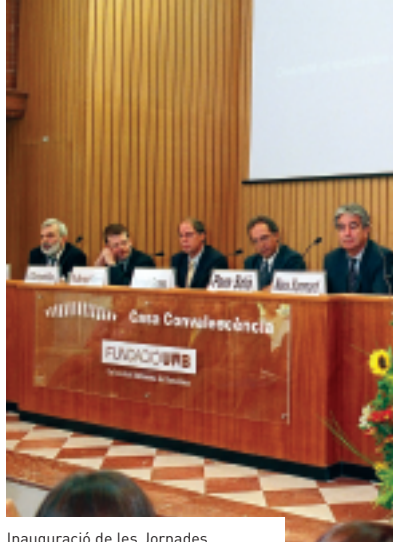
Inauguració de les Jornades.

El prestigiós crític literari francès Bernard Pivot, que ha estat director dels programes de televisió Apostrophes , Bouillon de culture i que actualment dirigeix Double je , ha participat en la vint-i-setena edició de les Jornades sobre l'Ensenyament del Francès a Espanya, que, durant els dies 8, 9 i 10 de setembre, han tingut lloc a l'edifici Casa Convalescència.