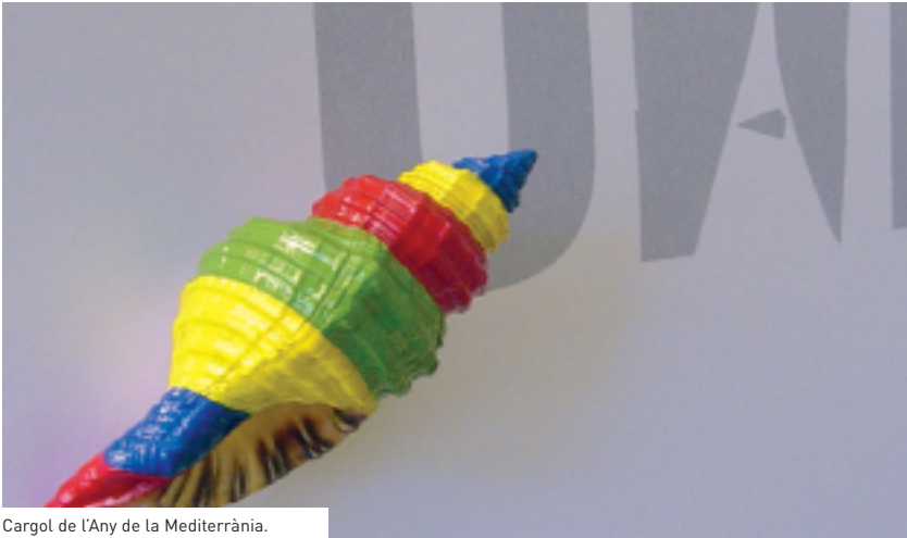
Cargol de l'Any de la Mediterrània.

► L'Autònoma dedicarà el curs acadèmic 2003-2004 a la Mediterrània per donar a conèixer la realitat dels pobles que l'habiten.