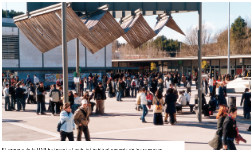
El campus de la UAB ha tornat a l'activitat habitual després de les vacances.

La veritat és que no em vull exigir tant a mi mateixa com he fet fins ara. Treballaré a fons, però prenent-me les coses amb una mica més de calma. Vull continuar estudiant idiomes, fer esport i altres activitats.