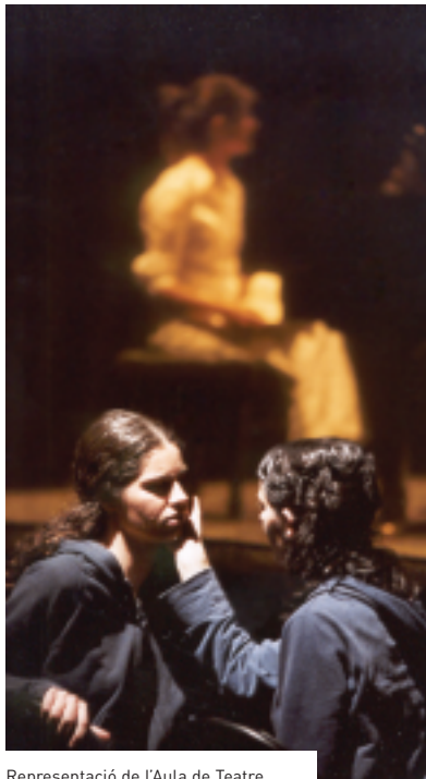
Representació de l'Aula de Teatre.

El Centre de les Arts de la UAB presenta la seva programació acadèmica per al curs 2003-2004. Cultura en Viu, conjuntament amb diferents centres de la UAB, ofereix un programa de formació artística que l'alumne pot integrar en el seu currículum acadèmic. Per als estudiants ofereix les Mencions en Teoria i Pràctica de la Creació Teatral i en Teoria de les Arts. Pel que fa a la formació continuada, organitzen el Màster de Dansa Moviment Teràpia, amb la col·laboració del Departament de Psicologia de la Salut i de Psicologia Social i el suport de l'Institut del Teatre; i Pensar l'Art d'Avui, cinquena edició del postgrau d'Estètica i Teoria de l'Art Contemporani, organitzat amb el Departament de Filosofia i la col·laboració de la Fundació Joan Miró. Organitza també diversos cursos i tallers, tant d'iniciació com de creació artística. Els cursos –de 24 a 180 hores– són convalidables per crèdits de lliure elecció. El període d'inscripció es va iniciar el 15 de setembre.