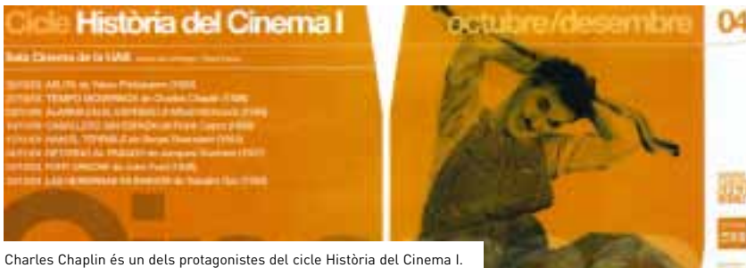
Charles Chaplin és un dels protagonistes del cicle Història del Cinema I.

Aquest augment del 30% dels complements de docència representa un cost per al DURSI de 733.592 euros. Per a l'any 2005, la Generalitat de Catalunya preveu que aquesta quantitat ascendeixi a més de setze milions d'euros.