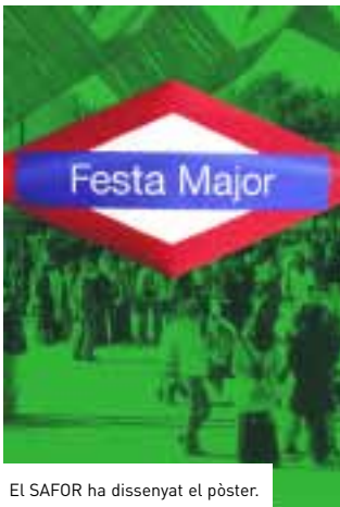
El SAFOR ha dissenyat el pòster.

La major part de les activitats del programa sorgeixen de les entitats, els serveis i els col·lectius més dinàmics del campus. D'altra banda, enguany s'ha posat en marxa el programa L'Autònoma Actua, amb l'objectiu de fomentar la participació de grups artístics aficionats for-