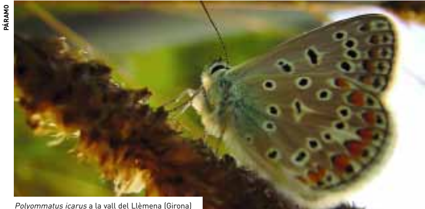
Polyommatus icarus a la vall del Llèmena (Girona)