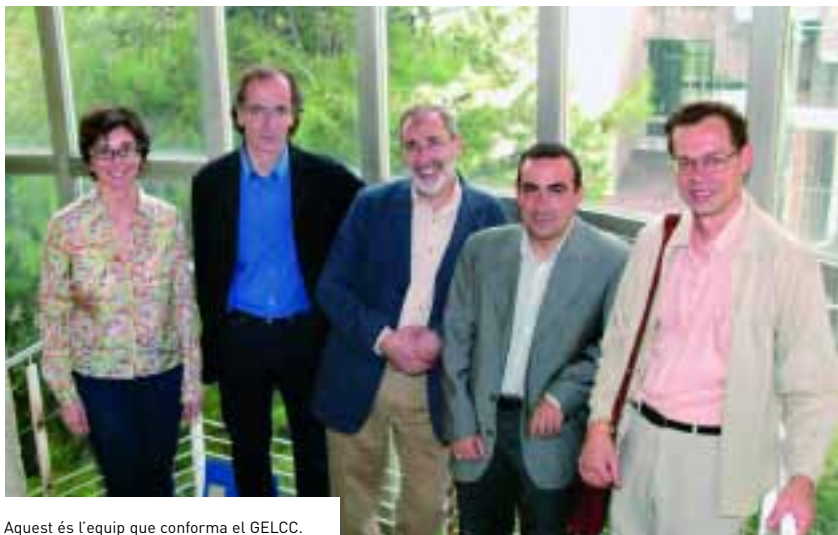
Aquest és l'equip que conforma el GELCC.

dors diversos, especialitzats en camps diversos i que apliquen, també, mètodes diversos. I, tanmateix, el grup ha adquirit una coherència metodològica considerable.