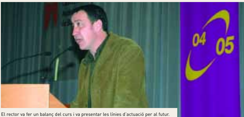
El rector va fer un balanç del curs i va presentar les línies d'actuació per al futur.

En l'àmbit de la investigació, va destacar tres actuacions: el pla de suport per a la formació investigadora del professorat en vies de consolidació, els ajuts per a grups emergents i noves línies de recerca, i la reestructuració de l'àrea de recerca orientant-la més a les necessitats dels usuaris.