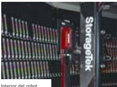
Interior del robot.

pament de processament de dades per als centres espanyols que participen en els experiments del Large Hadron Collider del CERN.