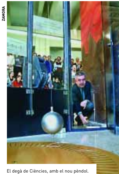
El degà de Ciències, amb el nou pèndol.