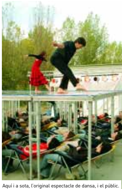
Aquí i a sota, l'original espectacle de dansa, i el públic.