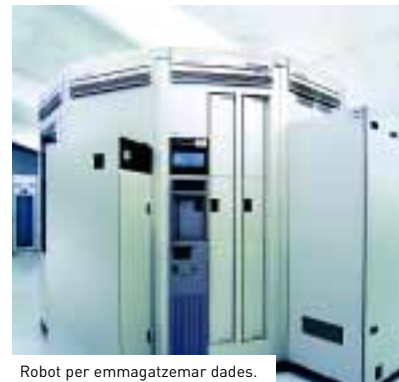
Robot per emmagatzemar dades.

El PIC també està explorant possibilitats d'allotjar i gestionar dades d'astrofísica, com les del telescopi de raigs gamma MAGIC situat al Roque de los Muchachos (Canàries), de genètica i proteòmica, i d'observació de la Terra.