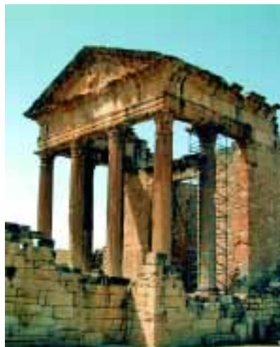
Les ruïnes de Dougga, on es faran pràctiques.

La setmana del 6 al 10 de desembre, la Unitat de Cristal·lografia i de Mineralogia de la Universitat Autònoma de Barcelona organitza, a la ciutat de Tunis, un curs sobre la restauració i la conservació de materials d'origen geològic emprats en el Patrimoni Monumental de Tunísia.