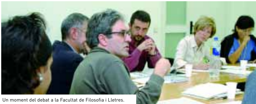
Un moment del debat a la Facultat de Filosofia i Lletres.

➤ El Grup de Recerca sobre l'Època Franquista de l'Autònoma organitza la jornada