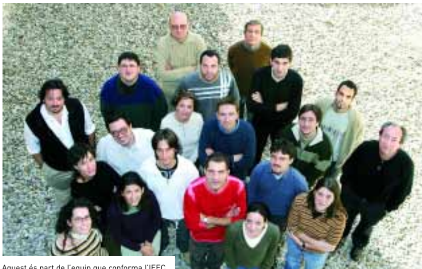
Aquest és part de l'equip que conforma l'IEEC.

la recerca sobre la Terra i el cosmos, fent servir tots els recursos disponibles, especialment aquells que es deriven de la tecnologia espacial, i també estudiar les possibles aplicacions que se'n puguin derivar amb l'objectiu de potenciar el sistema ciència-tecnologia-indústria.