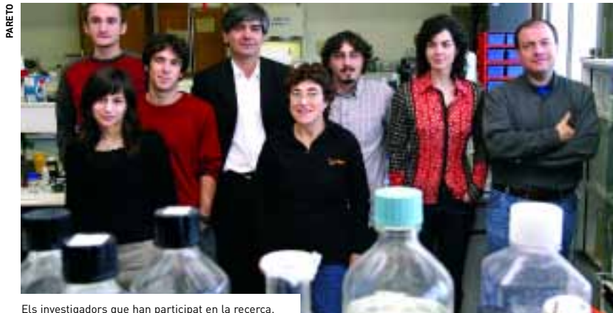
Els investigadors que han participat en la recerca.

Quan té lloc una lesió d'aquest tipus, les cèl·lules o bé moren directament o, en molts casos, són víctimes d'una mort lenta i programada denominada apoptosi, una mena de «suïcidi» a escala cel-