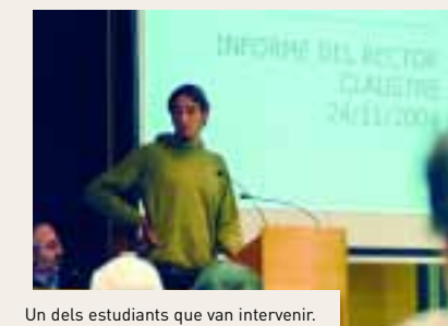
Un dels estudiants que van intervenir.