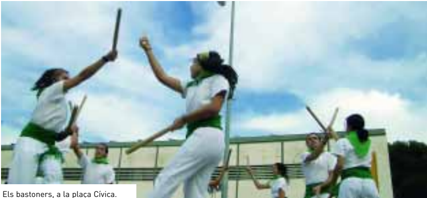
Els bastoners, a la plaça Cívica.

➤ Per primera vegada, es va instal·lar una deixalleria que va recollir més de mil quilos de vidre